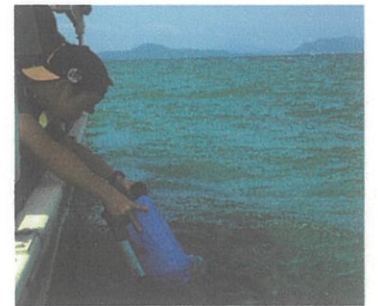
箱メガネによる水中観察の様子