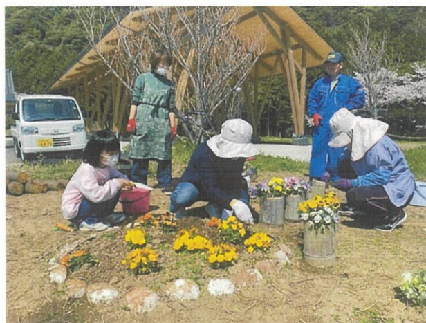
・たまキャン△みんなの花壇での作業の様子