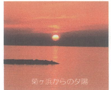
菊ヶ浜からの夕陽

特別料金 大人 1,200円 ⇒ 1,000円 小学生以下 600円 ⇒ 500円