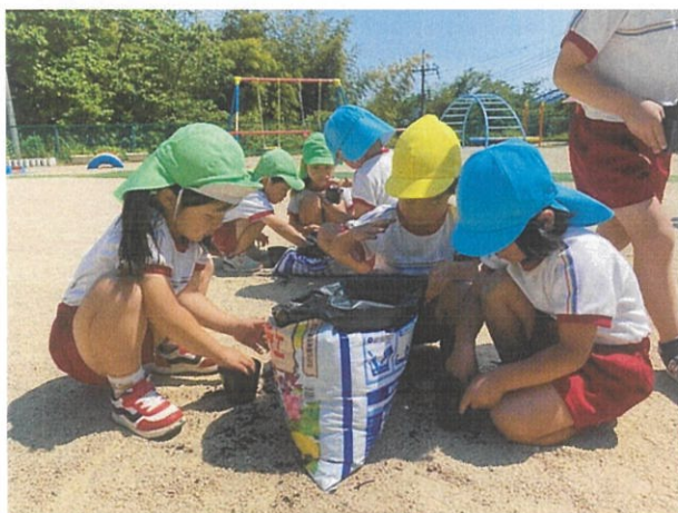
・田万川保育園でマリーゴールドの育苗の様子

地域の皆さんから田万川温泉とキャンプ場の間にあった空き地に「花壇があるといいな」という声があったので、「キャンプ場や温泉の利用者にも楽しんでもらえたら」という思いから地域おこし協力隊と有志の皆さんとで手作り花壇を整備しています。