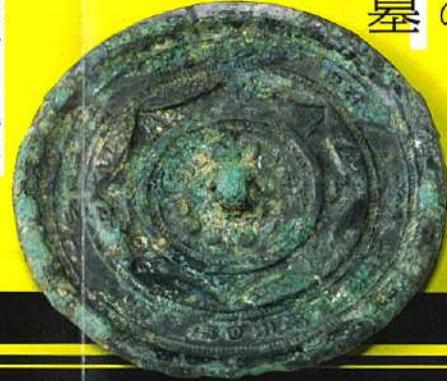
地蔵堂遺跡 連環文清(精)白鏡、蓋弓帽 国立歴史民俗博物館蔵