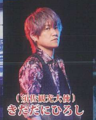
(須佐観光大使) きただにひろし

1977年ロックバンド「LAZY」のボーカルとしてデビュー。ソロ活動後、アニメ・特撮ソングに出会い、後世に残る名番組の主題歌を担当。2000年にアニソン界に大きな足跡を残す「JAM Project」を結成。現在、リーダーとして世界各地で活躍し、日本のアニソン界を牽引している。＜代表作品＞「鳥人戦隊ジェットマン」、「CHA-LA HEAD-CHA-LA」、「WE GOTTA POWER」(C X「ドラゴンボールZ」主題歌)、「聖闘士神話～ソルジャードリーム」(テレビ朝日「聖闘士星矢」主題歌)等