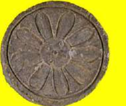
長門深川廃寺 軒丸瓦、軒平瓦 山口県埋蔵文化財センター蔵