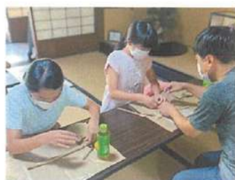
手びねりによる制作