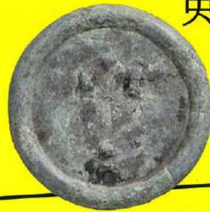
明地遺跡 分銅形土製品 山口県埋蔵文化財センター蔵 県指定