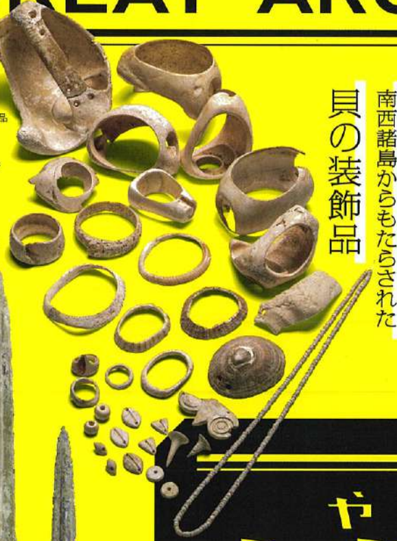
土井ヶ浜遺跡 貝製品 土井ヶ浜遺跡・人類学ミュージアム蔵 県指定