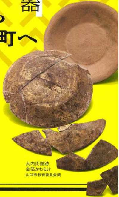
大内氏館跡 金箔かわらけ 山口市教育委員会蔵