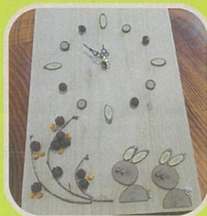
時計 もちの木工房