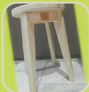
椅子 園田木型製作所