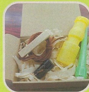
ひのき香るシャボン玉 萩アロマ蒸留所