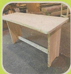
家具 阿武萩森林組合