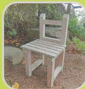
木工道具の使い方 （株）水建