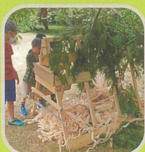
森の秘密基地 （株）萩・森倫館