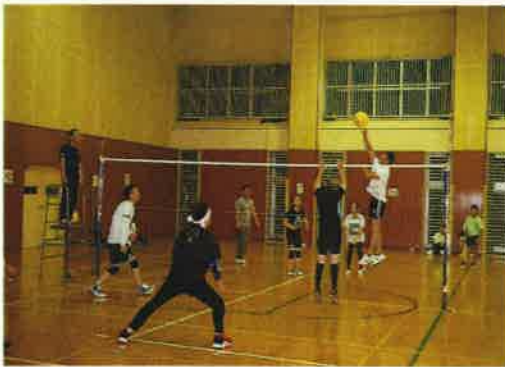
白熱の試合を展開中!