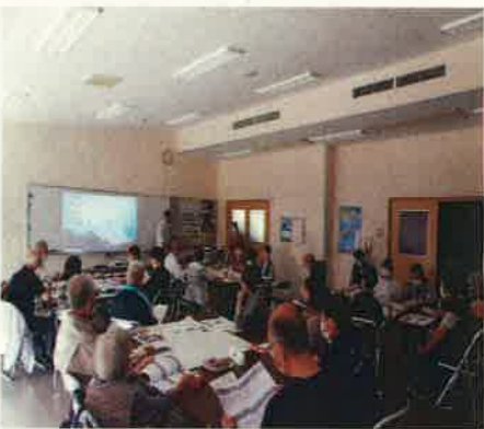
合同研修会の様子

6月9日(金)、むつみB&G海洋センターでむつみ支部老人クラブ連合会主催の福栄・むつみ支部老連合同研修会が開催されました。午前中は来月開催される萩市カローリング大会を前に練習を兼ねた交流会が行われ、午後からは会場をコミュニティセンターに移動して、山口県老人クラブ連合会光安活動推進員による講演と情報交換を通して問題点や解決に向けたグループ協議が行われ、参加者の親睦が図られた有意義な研修会となりました。