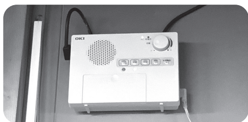
防災行政無線の受信機