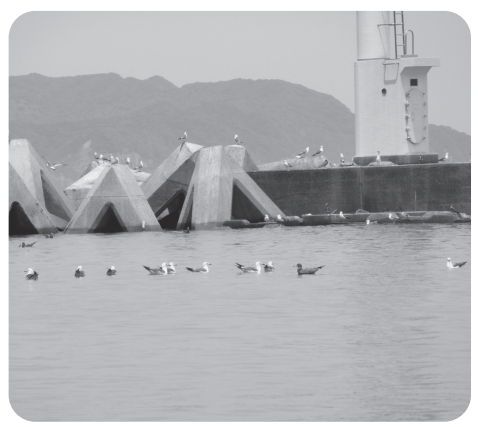
三見漁港防波堤のカモメ

殖しています。地元からは、うるさい鳴き声や糞尿の悪臭の苦情が届いています。漁港内の船の往来を妨げないよう、駆除を検討してください。