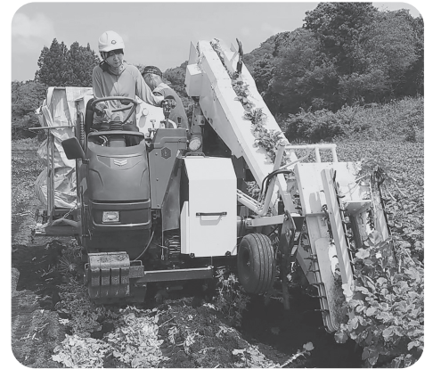
先進技術を活用した農作業風景

振興や販路の拡大、新規就農者等の担い手確保、育成、定着及び農業者の所得向上を目標に掲げ、県、JAなどの関係機関と連携し、持続的で力強い農業を推進しています。