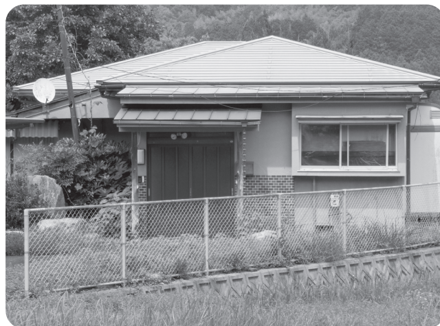
改修される医師住宅