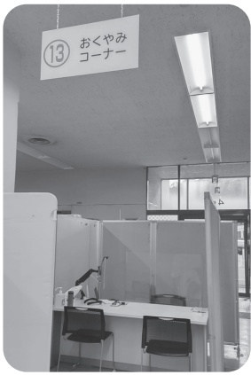
おくやみコーナー

萩市では、ワンストップサービスを掲げ、市民総合窓口を開設しています。これにより、死亡に伴う手続きをはじめ、各種手続きをされる方の負担の軽減を図っていると伺います。引き続き