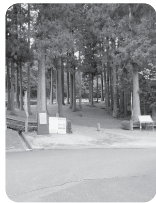
大板山たたら製鉄遺跡

SNSに投稿された情報が拡散されるなど、文字モニユメントの設置は、観光客獲得のための有効な手段と認識しています。見栄えのする大きさや色合いが求められるため、設置場所によっては関係機関との調整等も必要なことから、慎重に検討してまいります。