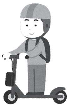
電動キックボード

今回の法改正にあたり、各校に対し、県から通知がされ、また萩市教育委員会から、情報提供もされました。現時点で実際に電動キックボードを使った研修会等を確認できませんが、今後も研修会等を含め、情報の収集及び提供をしていきます。