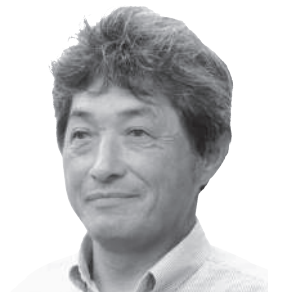
宮内 欣二 (日本共産党)