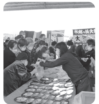
真ふぐ祭りの様子

漁業に関する課題の解決に向け、今後も漁業者や漁協・萩農林水産事務所など関係機関と連携し、萩の魚のブランド化の推進、効果的な栽培漁業や磯焼け対策など、水産業の活性化につながるよう施策を講じてまいります。