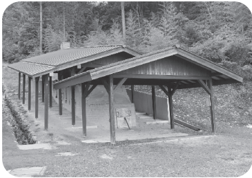
陶芸の村公園 登り窯

平成29年度から始めた登り窯を活用した窯焚きは、萩ならではのイベントとして好評をいただいております。施設の活用については、利用頻度や設置目的などを考慮する必要がありますが、関係部署との調整を図りながら、萩市として、どのような萩焼の振興やPRといった取り組みができるのか検討していきます。