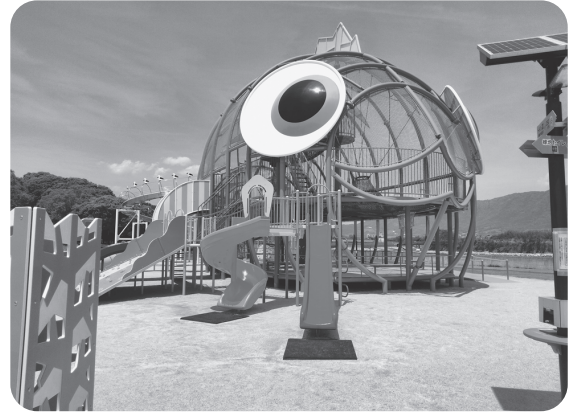
メバル公園（防府市）

インクルーシブ遊具は、障がいの有無等に関係なく、誰もが楽しく安心して利用することが