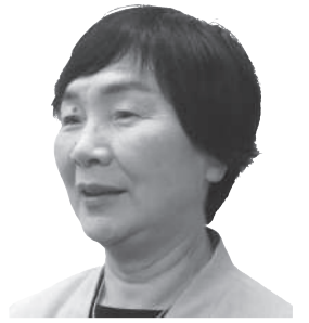
佐々木 公 恵 (公明党)