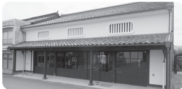
浜崎伝建地区町家モデル施設