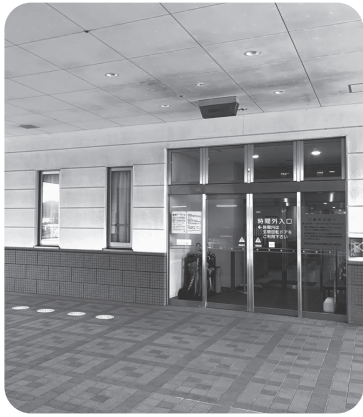
萩市民病院の救急入口