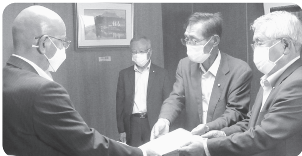
6月15日 市長に申し入れ書提出