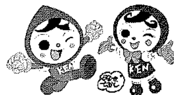
人権イメージキャラクター 人KENまもる君&人KENあゆみちゃん

https://www.pref.yamaguchi.lg.jp/soshiki/36/