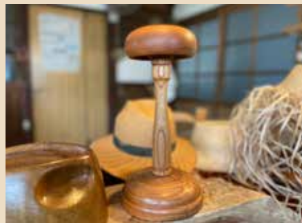
スタンドは日本橋三越本店でも販売された