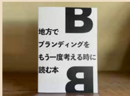
参考資料として自身で本の制作も行った