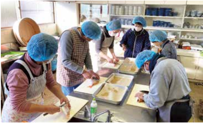
萩体験ツアーの様子