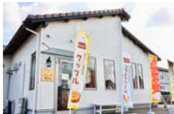
店内にはイトインスペースも併設