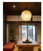
庭を眺めて落ち着ける 囲炉裏を配置