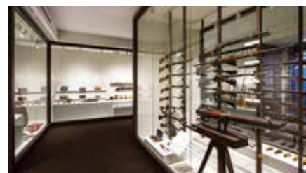
2号館 幕末ミュージアム