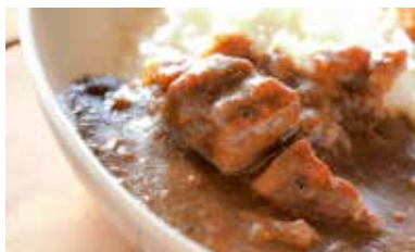
むつみ豚カレー。リピーターも多い