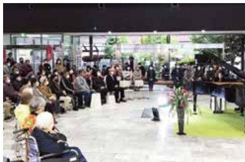
ピアノコンサート

身近に音楽に触れる機会の創出や、文化芸術の振興と市民の皆様から親しまれる市役所を目指し、毎月1回（第1水曜日）、市役所ロビーにおいて、ロビーコンサートを開催しています。