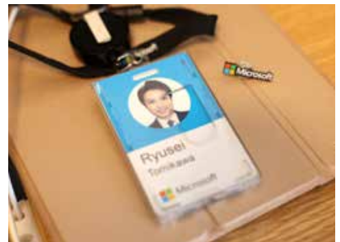
世界中のオフィスに入館できる ID カード兼社員証