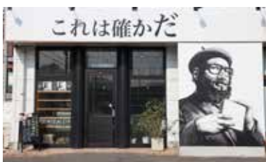
アトラス萩ショッピングパークの一角