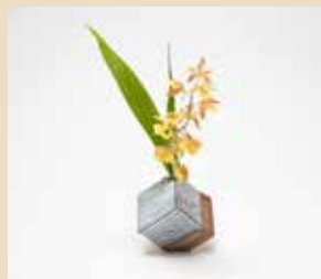
『萩角花入』波多野指月窯/波多野英生