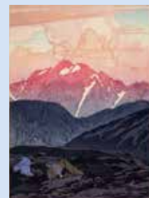
「日本アルプス十二題の内 剣山の朝」 吉田博