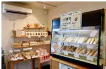
ミニワッフルは8種類ほどが並ぶ