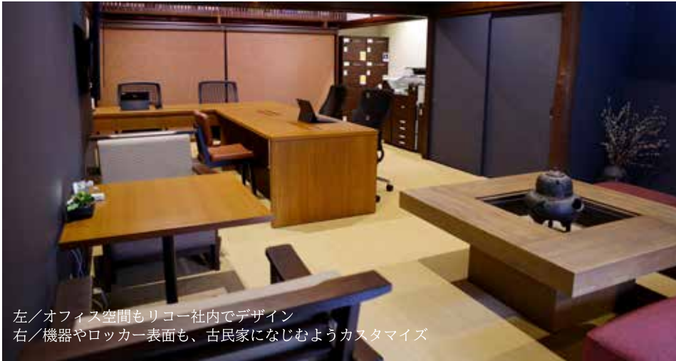
左/オフィス空間もリコー社内でデザイン 右/機器やロッカー表面も、古民家になじむようカスタマイズ