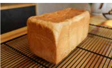
プレーンタイプの「家宝」864円