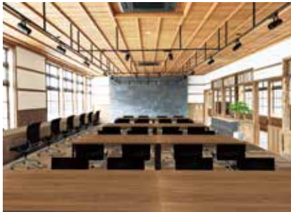
コワーキングスペース (2階)