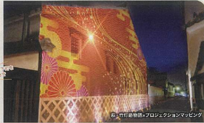
萩・竹灯路物語×プロジェクションマッピング