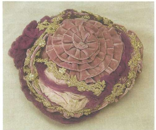
写真/左：露国に対する宣戦の詔勅案（明治天皇の日露開戦を告げる詔勅の草案）【初公開】 写真/右上：桂太郎が着用した陸軍大将正帽 写真/右下：可那子夫人が着用したボンネット