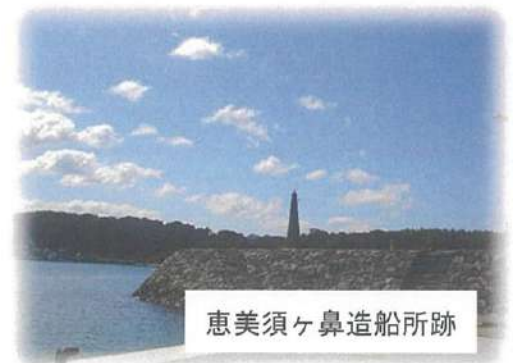
恵美須ヶ鼻造船所跡

当該遺跡は、数少ない幕末造船所跡の一つであり、近代的技術が日本に導入された特徴を知る上で貴重です。