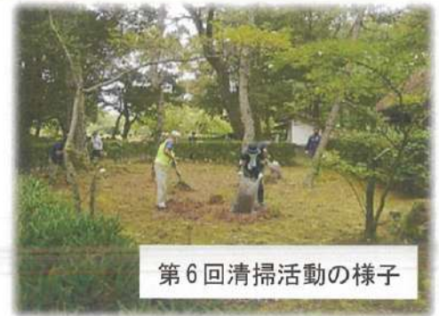
第6回清掃活動の様子