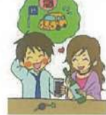
車に乗って来た人にお酒を提供した人