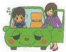
飲酒運転の車に同乗した人