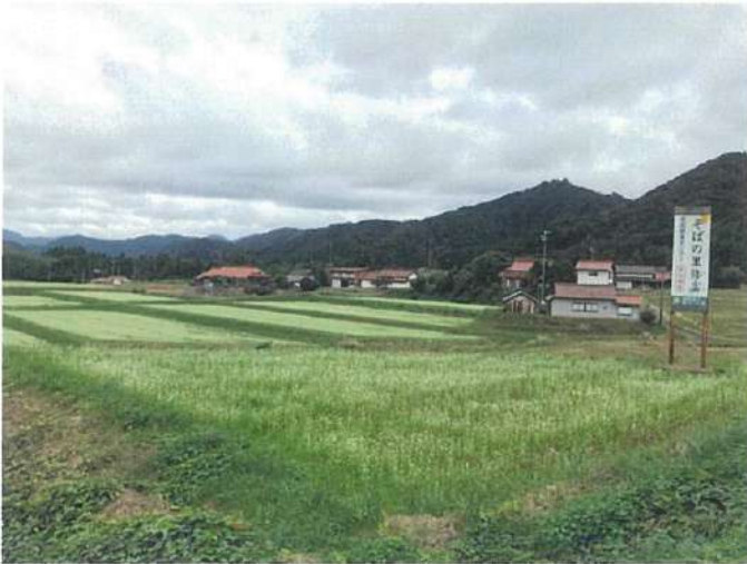
国道 315 号 そばの里看板