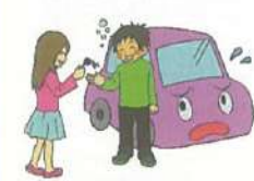
お酒を飲んだ人に車を貸した人