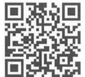
萩市共通商品券協同組合 ホームページ

■問合せ先 萩市共通商品券協同組合事務局(萩商工会議所・電話0838-25-3333)