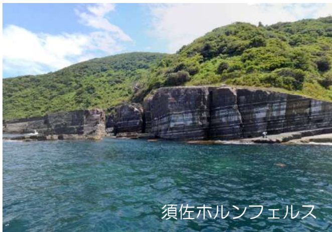
須佐ホルンフェルス