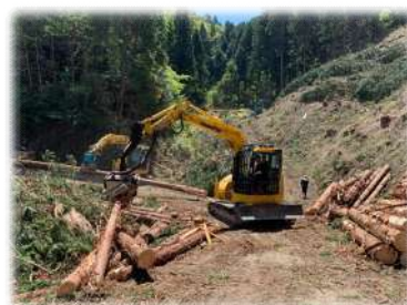
森林団地内の作業の様子