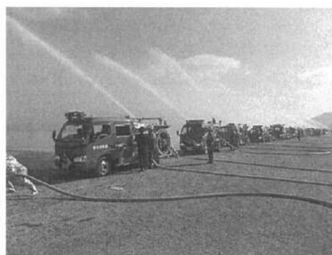
（中央方面団一斉放水の様子）