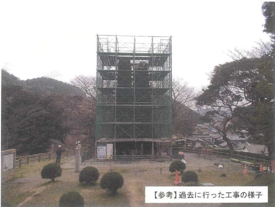
【参考】過去に行った工事の様子

単管及び鳥居型枠組 7段 東西7.3m、南北5.6m、高さ12.7m 周囲はメッシュシートで覆う