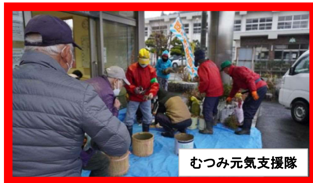
むつみ元気支援隊