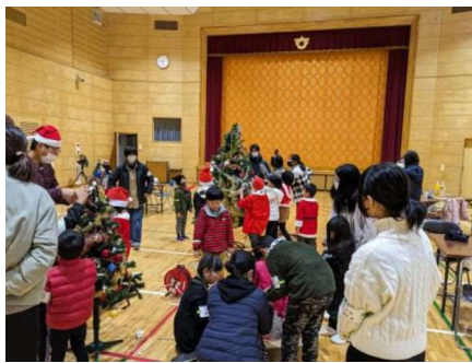
クリスマス会の様子

昼食後は、むつみジュニアリーグダーズクラブの会員によるゲームを行い、参加者たちは楽しい1日を過ごしました。