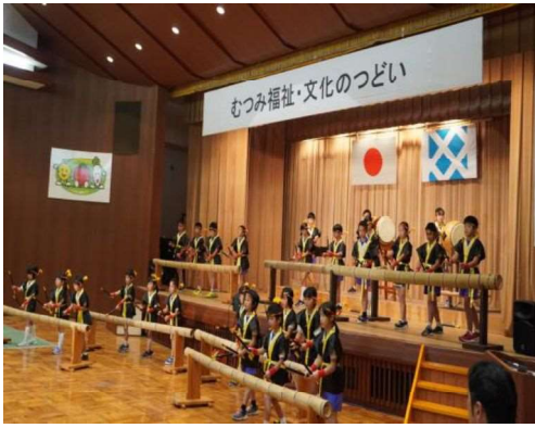
むつみ小学校児童による竹太鼓の演奏

当日は約200名の方の参加があり、舞台発表では、最初にむつみ小学校児童による竹太鼓の演奏ではじまり、続いてむつみ保育園児の遊戯、むつみ中学校生徒等の合唱やむつみ神楽保存会（子ども神楽）の神楽舞演技や各種団体等の皆さんがステージ上で普段の稽古の成果を披露しました。