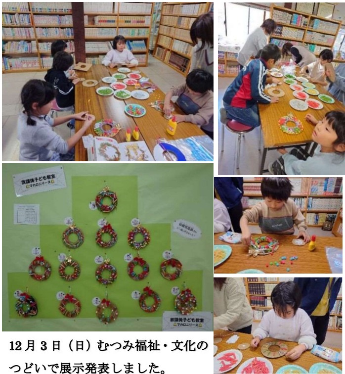
12月3日（日）むつみ福祉・文化のつどいで展示発表しました。

11月17日（金）萩市むつみ生涯学習資料館図書室で保健推進員さんとマカロニリース作りをしました。マカロニを貼り付ける台（ダンボール）、はさみを上手に使い自分でカットし、赤や緑にあらかじめ色付けされたかわいい形のマカロニも均等に並べボンドで貼り付け、手芸用のポンポンは色の順番を考えようようにそれぞれ素敵なリース作りをしました。