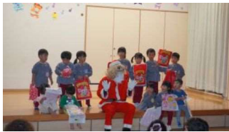
クリスマス発表会の様子