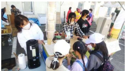
11.3 むつみふるさとまつり出店の様子