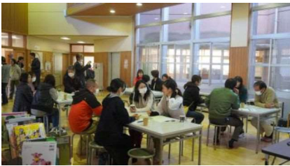
11.21 むつみ小学校出店の様子