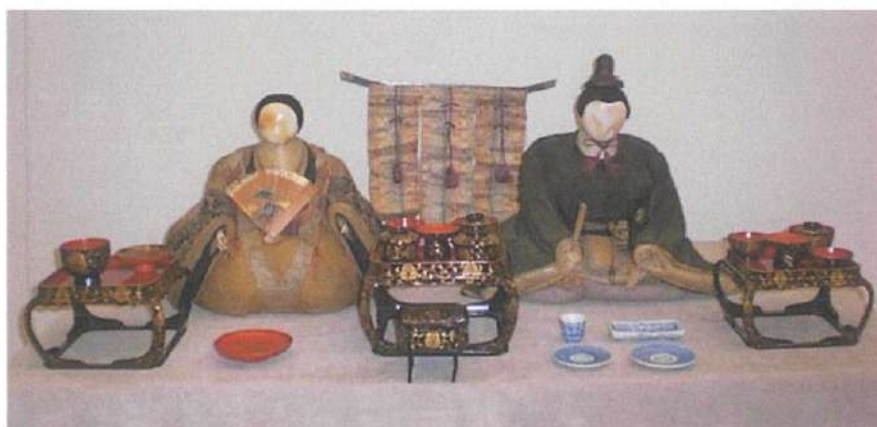
高杉家由来の次郎座衛門雛

雛人形のスタイルは、江戸時代初期に京都の雛屋次郎左衛門が作り出した「次郎左衛門雛」と呼ばれるもので、まん丸に近い顔に引目鉤鼻の面相が特徴です。高杉晋作には3人の妹がいましたので、雛祭りの季節には、高杉家は華やかな雰囲気にも包まれていたのではないかと想像をかきたてられます。