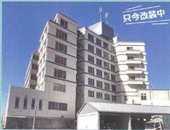
グランド萩東館（賃貸住宅・オフィス）

萩市が抱える課題に取り組んでいく複合施設として2024年4月に東館が始動します。賃貸オフィス・賃貸住宅・高校生寮・看護師寮として生まれ変わります。多くの萩市の皆様にご活用いただければと思っています。