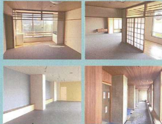
改装中（居室・食堂・オフィス）