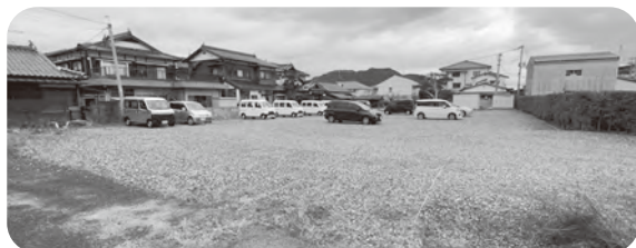
建設が予定される旧総合福祉センター跡地

なお、分庁舎の一部を、山陰西部国道事務所の執務室として国へ貸付けることを検討しており、実現すれば、市と国との連携が今以上に強化され、山陰道の整備促進につながるものと考えます。