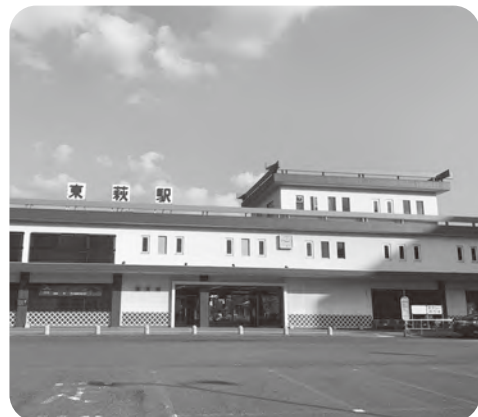
東 萩 駅

体、住民、事業者など、地域が一体となって、日常や観光の利用促進事業に取り組むことを通じて、JR山陰本線と地域の活性化を図るため、「マイルール意識」、「魅力発信」、「ツーリズム」の3つのテーマで、事業を進めていくことを、今後の基本方針として決定しました。現在、今後の事業展開について、各市町の担当者が定期的に協議を行い、検討しています。萩市としても、JRや駅舎を活用したイベントなどについて、活用案の募集なども含めて検討します。