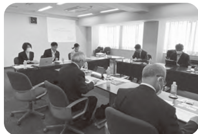
益田市での行政視察