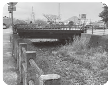
松陰神社(松下橋)交差点前の橋

答 月見川の橋の管理について、萩市の管理は、松下橋のみで残りの4橋は不明です。一般的に、所有者が不明な場合は、河川法に基づいて河川管理者である山口県が対応していくこととなります。昇降階段の新設については、山口県に現地確認いただき、設置に向けて検討いただくよう、要望してまいります。