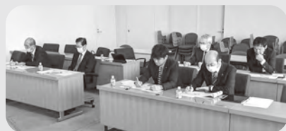
あきる野市での行政視察