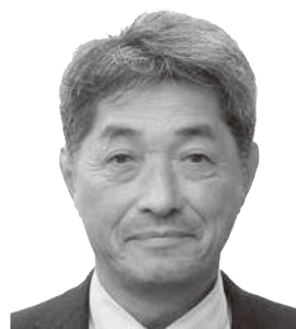
宮内 欣二 (日本共産党)