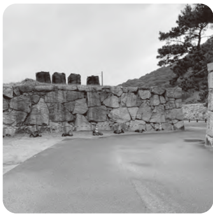
萩城跡 東門跡の石垣に設置された大型土のう

では、毎年薬剤による予防対策を実施し、被害発生時には、危険性・緊急性などに応じて適切に対処しています。今後も安心・安全な環境を維持できるように管理に努めてまいります。指月山は国の天然記念物に指定されているため、大規模な伐採は困難ですが、山頂から城下町や笠山等が眺望できるよう枝払いを行っていき、山頂の矢倉の石垣を麓から望むことができるように努めています。また、登山道や山頂のビュースポットに案内板を設置し、来訪者が指月山からの景観を楽しむことができるよう努めています。