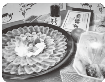
トラフグ、ちり鍋セット