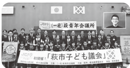
萩市子ども議会参加者の皆さん

昨年、11月18日(土)に萩市初の『萩市子ども議会』が萩市・萩市教育委員会共催、萩市議会後援で開催されました。萩市内の中学生から“理想の萩市”の実現に向けた提言を募集し、163名の応募者から15名の子ども議員と5名の見学者が議場に集いました。議会では、市長および教育長が直接、答弁しました。自分たちが考えた提言を堂々と発表する姿に萩市の明るい未来を感じました。（※見島からの参加はオンラインとなりました。）