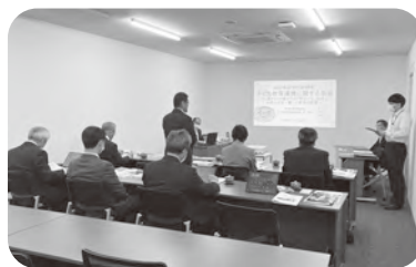
草加市での行政視察