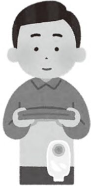
オストミー支援用具 パウチ装着のイメージ

答 オストミー支援用具の基準額の見直しについては、物価高騰を踏まえ、他の使用頻度の高い日常生活用具を含め、価格の調査等を行い、検討していきたいと考えています。