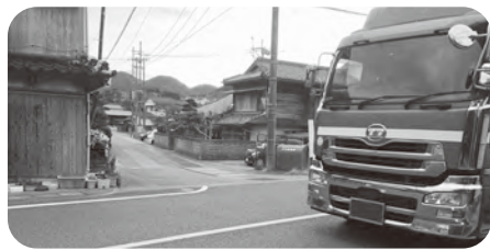
国道191号⇒市道瀧港後小畑線

答 市道瀧港後小畑線は、平成9年に道路幅員を広げる対策を行っていましたが、通勤時間帯には混雑が確認されています。大幅な交