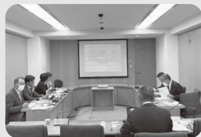
掛川市での行政視察

焼津市では、ドローンを活用して災害の発生状況を的確に把握し、救助・支援計画がスムーズに立てられるよう組織化されました。火災では、通報から数分で、空から延焼状況や消防車の消火位置等を把握し、素早い消火に役立っているとのことでした。