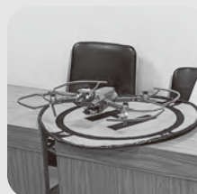
秦野市のドローン