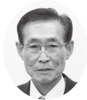
萩市議会議長 長岡肇太郎