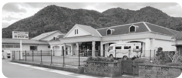
萩市立須佐図書館 まなぼう館

答 夜間利用者の減少や利用上のマナーの問題、防犯・管理上の課題が確認されていることから、調整が必要です。