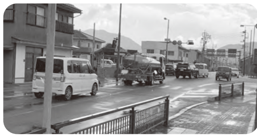
渋滞時の御許町交差点