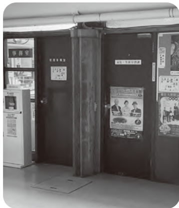
相談窓口のある文化・生涯学習課

答 障がいの有無に関わらず、訪問活動等を含め、継続的で、個別の状況に応じた支援が重要と考えます。