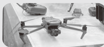
焼津市のドローン