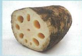
「まち」を支えた意外な存在！