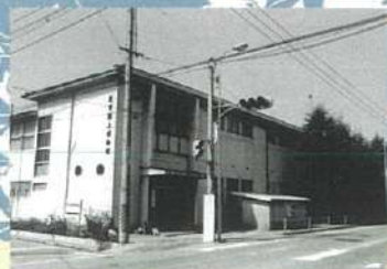
萩市郷土博物館(1988年撮影)