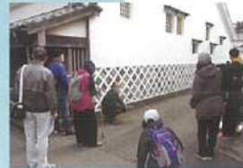
萩の「おたから」を守ったのはだれ？