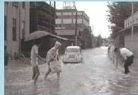
もしかしたら「まち」の姿が変わっていた？