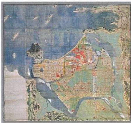
県下最大級の城下町絵図

本年は「萩まちじゅう博物館」がスタートしてから20年となります。今回の展示は、なぜ、萩は「まちじゅう」が屋根のない広い博物館といえるのか、江戸時代から大きく変わらない萩の「まち」に息づいている魅力やひみつを、萩城下町を描いた絵図などの資料とともに、「低湿地」・「夏みかん」・「鉄道」・「災い」・「誇り」などのキーワードから紹介する20周年記念企画展を開催しますので、お知らせします。