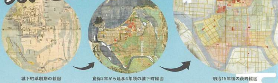
城下町草創期の絵図