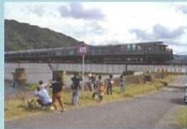
鉄道と「まち」の不思議な関係！