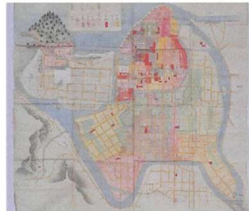
明治15年ころの絵図