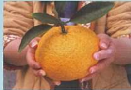
夏みかんが「まち」を救った！？