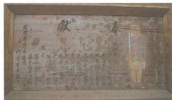
金谷神社の異人的額

また、装條銃射撃の的にした西洋人を描いた、奉納的額は管見のところ他に例がなく、貴重な歴史的遺産である。