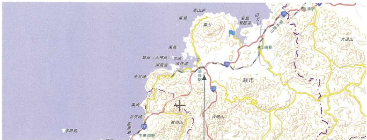
新工場建設予定地