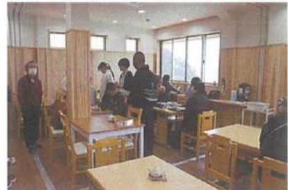
食堂スペース拡張