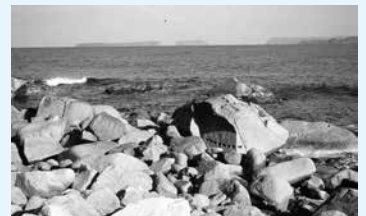
指月山北東岸の石切場