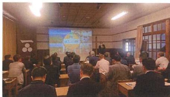
昨年開催された「第18期グループCIO交流会議」の現地交流会の様子（2023年10月20日）

時間：午後2時15分～午後4時15分 場所：萩・明倫学舎 本館2階 展示映像室 内容：講演会、萩・明倫学舎見学