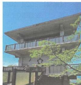
笠山山頂展望台『鳶ノ巣』