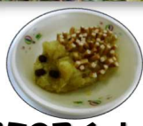
「ハリネズミのスイートポテト」