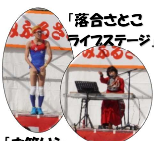
「お笑いショーもこちゃん」