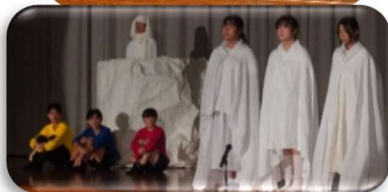
「日頃の学習の成果 小学生中学生それぞれの発表」