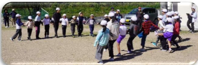
「♪負けてくやしいはないちもんめ」