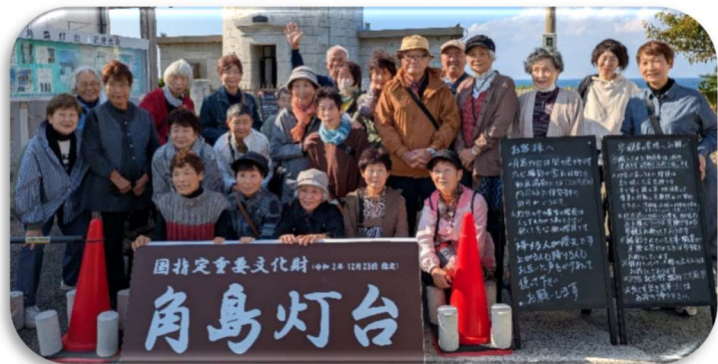
「みなさんいい笑顔です」