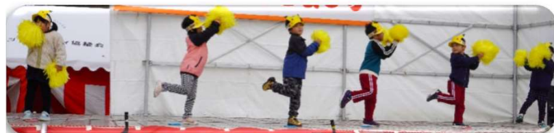
「むつみ保育園演技発表」