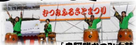
「奥阿武むつみ太鼓」