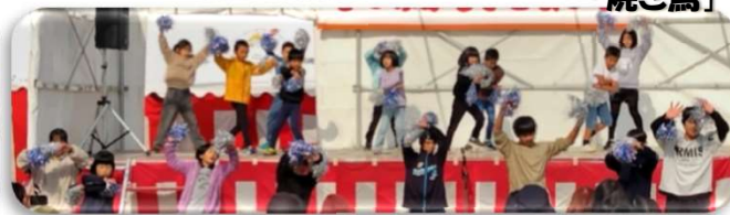
「むつみ小学校演技発表」