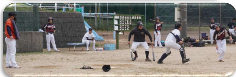
「全力プレーが一番カッコいい！ 楽しんでいる姿がいいですね」