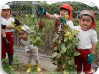
「たくさんとれたね」

後日、クッキング教室で、収穫した芋を使って、見た目も楽しいハリネズミのスイートポテトを作り美味しそうに食べていました。