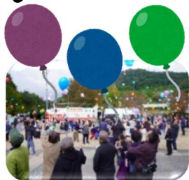
「バルーンリリース」

終わりに、ふるさとまつりの準備から実施までに携われた関係の皆さま大変お疲れさまでした。