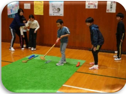
「幅広い世代が誰でも一緒に楽しめて、ルールがシンプル」

どちらのスポーツも、ルールがとても簡単で誰でも出来るスポーツで、参加者は、楽しくプレーし交流を深めていました。