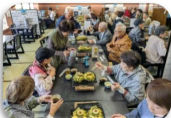
「美味しそうな瓦そば」「きれいなお花がいっぱいですね」