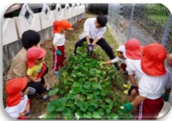
「おいしょ、おいしょ」