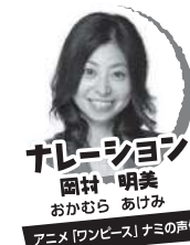
ナレーション 岡村 明美 おかむら あけみ アニメ「ワンピース」ナミの声優

東京アナウンスアカデミー卒業後に江崎プロダクション（現マウスプロモーション）付属養成所入所。1992年よりマウスプロモーションに所属。「紅の豚」（フィオ・ピッコロ）、「ONE PIECE」（ナミ）、「海月姫」（まやや）、「たまごっち!」（まきこ）、「ラブ★コン」（小泉リサ）をはじめ、数多くの有名作品に出演し、人気を博す。