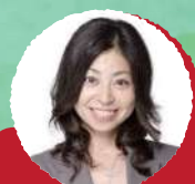
ナレーション 岡村 明美