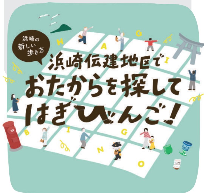
illustration by Suzu Tsuzuki