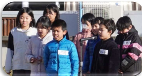
「元気いっぱいの発表」

1月14日(水)、お正月飾りや書初めなどを燃やして、今年の無病息災を願う「どんど焼き」がむつみ小学校で行われました。