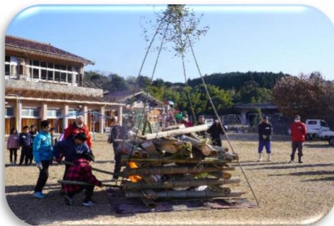
「無病息災・家内安全」