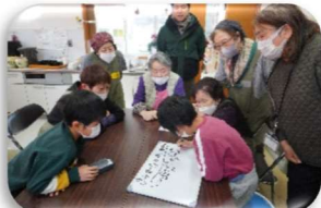
「みんなと楽しいゲーム」