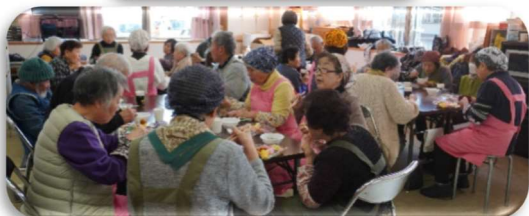
「美味しいちらし寿司」