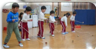
「こま回し、カルタとり、楽しいお正月遊び」