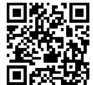
詳細・申込フォーム