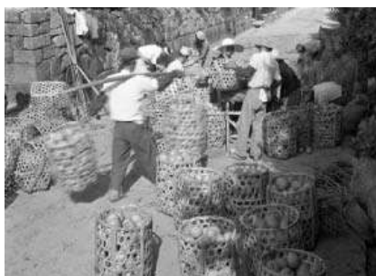
夏みかんの収穫風景の古写真