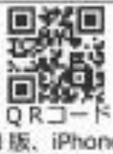
QRコード (Android 版、iPhone 版共通)