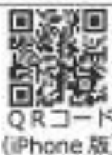
QRコード (iPhone 版)