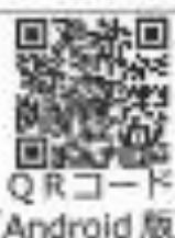
QRコード (Android 版)