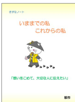
きずなノート (萩市版エンディングノート)

エンディングノートに希望する葬儀形式を記載しておくことで、残された家族が本人の意思を尊重し、故人らしいお見送りを実現できます。