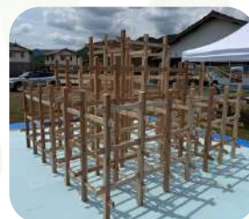
くむんだー ..... （有）山根建築