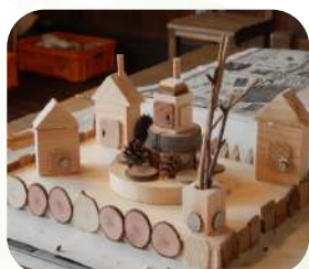
小さな木のお家作り ..... もちの木工房