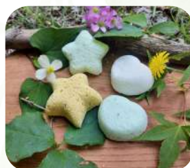
森の自由研究（バスフォーム作り） ..... 萩アロマ蒸留所