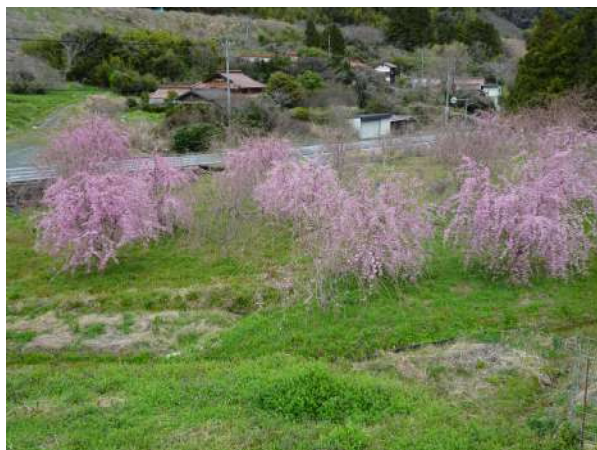
【さくら公園のしだれ桜】