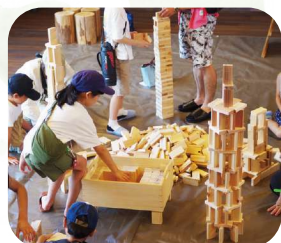
MOKUMOKU プレイルーム ..... （株）萩・森倫館