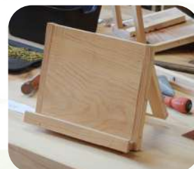
タブレットスタンド作り ..... （有）勝田組