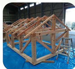
上棟・木工（椅子）体験 ..... （株）水建