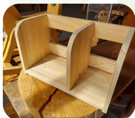
本棚作り ..... 阿武萩森林組合