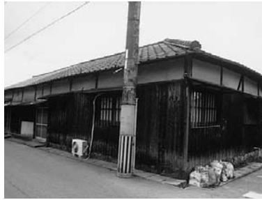
横地長左衛門旧宅地