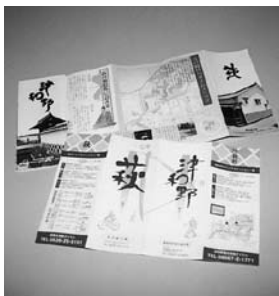
2種類の新パンフレット

消費低迷が続き、旅行形態も「安・近・単」の傾向にある中、萩・津和野の2つのまちが都市圏での共同宣伝を行うため、新しくパンフレットとマップの2種類を同時に作成しました。