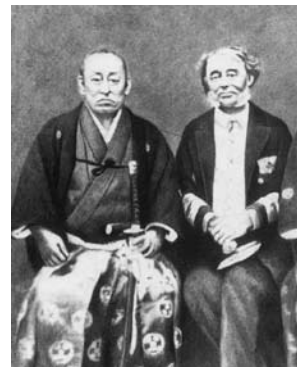
慶応2年(1866)暮れ、三田尻で英国海軍キング提督と会見した毛利敬親

「その後、感慨やむ能わざることこれあり。亡命仕り候ところ、後にさる人より承り候ところその節、君公、国の宝を失ったとの御意ありし由、一乳臭、国に何の損益ありて、かく有りがたく仰せられ候ことか、何とも