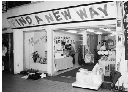
生徒たちが運営する「FIND A NEW WAY」

萩商業高校の生徒が商店街の空き店舗を活用し、運営する小売店「萩商 FIND A NEW WAY」が5月27日、萩市田町商店街にオープンしました。これは、地域と協力し、経営を実際に体験することで、将来の起業家を育成しようとする97年から始められたものです。