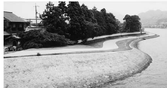
玉江橋から見た河添河川公園

この河川公園と平安古地区の土堀の整備により萩の景観もより一層美しく変わりました。