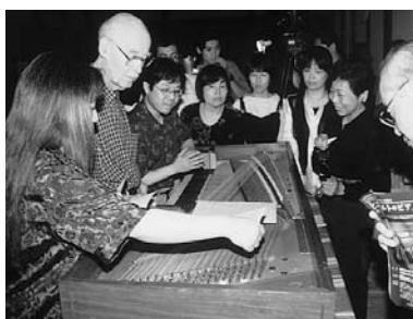
コンサート前のピアノ修復の様子