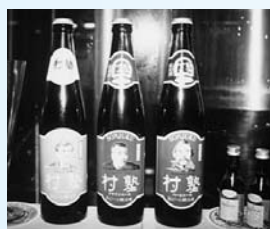
「村塾」維新三傑ビール 500ml×3本 2700円

JR東萩駅前萩レインホールにある2つのお店では、萩ビール「村塾」が味わえます。レトロ調の店内が、外国のビールバブに迷い込んだような「村塾」では、シェフが心をこめて作った料理も一緒にどうぞ。 0838・24・0011