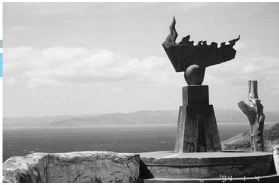
青森県津軽半島の龍飛崎 たつびさき に立つ「吉田松陰」詩碑。東北遊歴で松陰は龍飛崎の手前まで行き、対岸の北海道・白神岬を遠望した

吉田松陰が年少のころから藩主毛利敬親 たちかちか にとくべつ目をかけられ、20代初めには二人が孫子勉強会を通じ深く理解し合ったところまで書いた。松陰には常に、自分は公にほめられすぎている、愛顧をうけすぎているという意識がつきまとう。「きっと御恩に報いなければならない」という思いが、さらに「死んで報いるほかはない」とエスカレートしたのは、松陰が亡命事件をおこしたとき敬親がもらした一言による。「国の宝を失うた」。この言葉が感激屋・松陰 きんせんと の琴線に決定的にふれたのである。