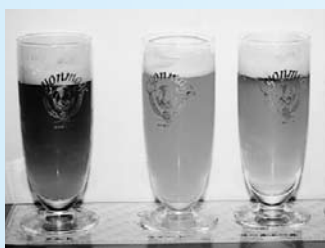
地ビール「チョンマゲ」 330ml×6本 3300円