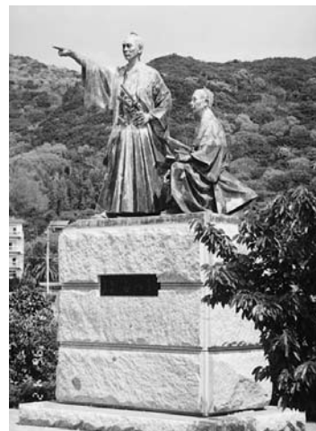
下田市柿崎の公園に立つ松陰と金子重輔 しげのすけ のブロンズ像「踏海の朝」

あれしきのことに、なぜかくも厳しかったのか。それは、藩官僚たちが松陰の行為を「上を憚らず却って他国人へ信義を立て候心底、本末転倒の儀、その筋相立たず」とみたからだ。封建制を支える規律をないがしる