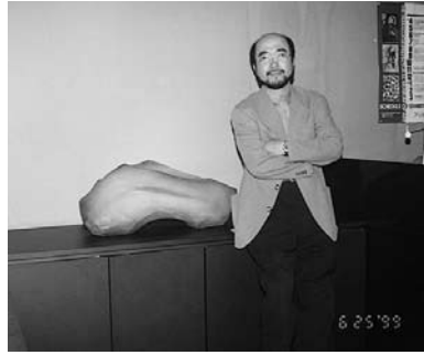
彩陶庵ギャラリーにて