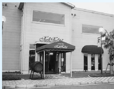
雰囲気のある外観

地ビール「チョンマゲ」が味わえる、マリーナ萩内にあるレストラン。木目調の店内は250席あり、広々として開放的な雰囲気。目前に広がる海を眺めながら飲むビールの味は、格別です。パスタ、肉などの本格的イタリア料理や日本海の新鮮なシーフードと一緒に楽しめください。 0838・24・3500