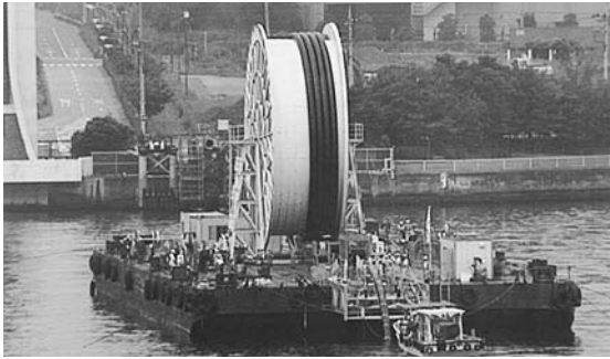
7月下旬から布設船が送水管を布設します