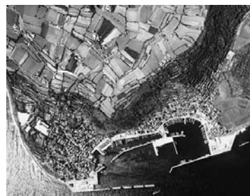
島の南側に密集する大島の集落

トップクラスの水揚げを誇っています。特に近年ブランド化され、今が旬の「瀬付きアジ」は脂がのり、大変美味しく、萩沖の好漁場から市場へ出荷される大半が、大島から水揚げされるものです。 大島に若者が多いのは、このような充実した地場産業があるからでしょう。 ちなみに、18歳の漁業従事者の月給は少なくとも20万円、多い月には50万円から100万円にもなり、年間9ヶ月就業での所得がなんと500万円前後にもなるといいます。この所得も日本一といえるのではないのでしょうか。 また、4月には数え歳の33歳を迎えた若者を盛大に祝う「歳祭り(歳祝い)」も行われています。 多くの若者が残り、活気のある島、これぞ大島が「ヒカリ・輝いている島」の要因の一つで、日本一の島といっても過言ではありません。