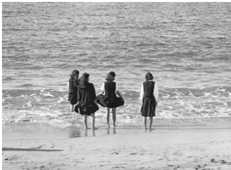
無性に足をぬらしてみたくなる修学旅行―菊ヶ浜

下瀬さんは、萩の風土や暮らしをやさしい視線でとらえた「萩」「風のとぎ」「風の中の日々」などのシリーズで昨年、山口県文化功労賞を受賞。「これからも萩をテーマに撮り続けたい」と話されています。