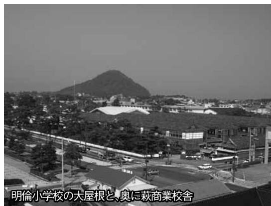
明倫小学校の大屋根と、奥に萩商業校舎

学校機能を移しながらも、小学校本館や水練池、有備館など建物はそのまま残すことで、貴重な文化財であり、観光スポットとして人気の高い明倫小学校の保存を図ります。