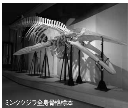
ミンククジラ全身骨格標本