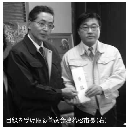
目録を受け取る菅家会津若松市長(右)