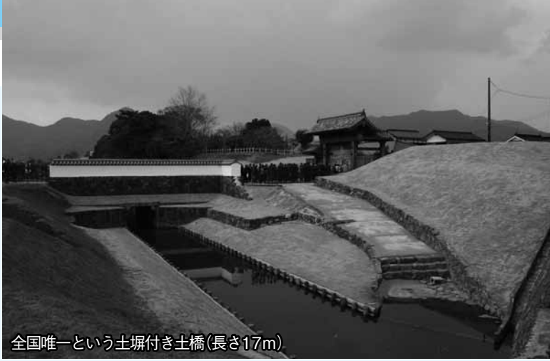
全国唯一という土堀付き土橋（長さ17m）

地元萩の技術者たちが復元した北の総門。萩市が掲げる「萩まちじゅう博物館」にとつて、江戸時代へタイムスリップできる新たな入り口が完成しました。