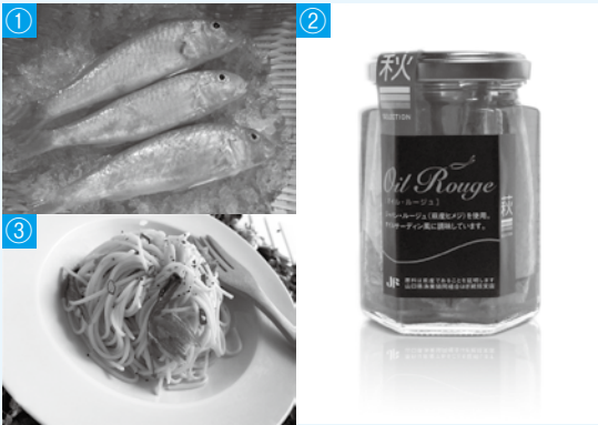
①「萩の地魚、もったいないプロジェクト」の代表的存在でもある金太郎 ②オイル・ルーージュ：ジャパン・ルーージュ（萩産ヒメジ）を使用、オイルサーディン風に調味しています ③金太郎の Pasta

■お取り寄せ 萩しーまーと／萩市椿東 4160-61 ☎ 0838・24・4937 (受付)