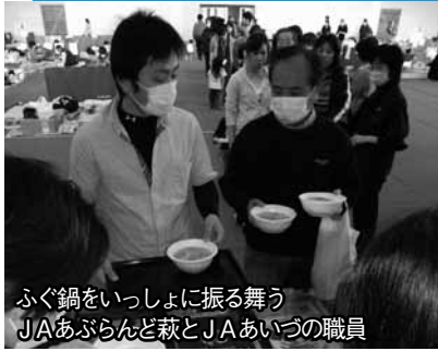
ふく鍋をいっしょに振る舞う JAあぶらんど萩とJAあいつの職員