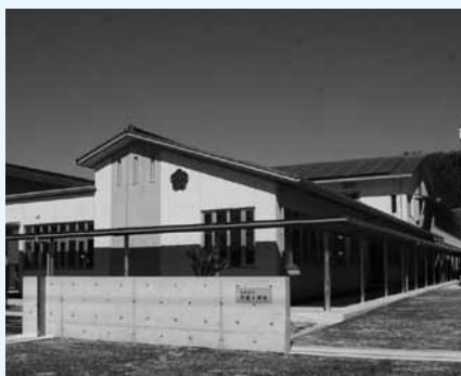
▲阿武小学校の新校舎

明治6年の開校以来138年の歴史を歩んできた「奈古小学校」が改築にともない校名を「阿武小学校」変更することとなり、4月5日に奈古小学校閉校式と阿武小学校開校式が行われました。