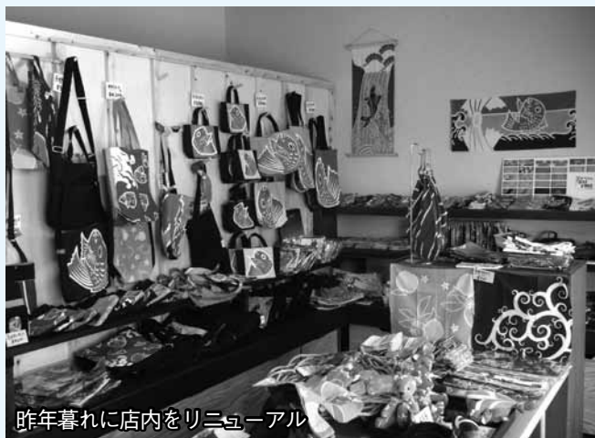
昨年暮れに店内をリニューアル

萩に創業100年以上の岩川旗店があります。本来、旗・幕・のぼりの製作が専門ですが、大漁旗・手拭など当店で染め上げた生地を生かしてオリジナル小物を作っています。