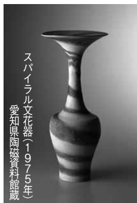
スパイラル文花器(1975年) 愛知窯陶磁資料館蔵

ウィーンに生まれ、ロンドンで活躍した20世紀を代表する陶芸家ルーシー・リー(1902〜95)の優れた作品を、英国・ドイツの海外コレクションや国内の秀逸なコレクションなどをはじめとする貴重な関係資料でたどる本格的な大回顧展です。 当時の先鋭的な建築やデザイン