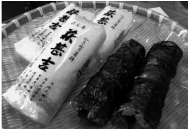
首都圏のスーパー「紀ノ国屋」で常時販売されています。

終わりが大正の始めだと聞きます。もちろん機械なんてない時代です。から、他の蒲鉾屋同様、萩沖であがったエソを捌き、搦って、叩いて、晒して、絞り、板に載せ、成形し、焼くという、工程をすべて手作業でやっています。そんな初代も私が保育園に上がるときに亡くなり、2代目は職業軍人であつた祖父に代わり、嫁いできた身の祖母が跡を継ぎます。その姿を見て育ち、蒲鉾作りは手間のか