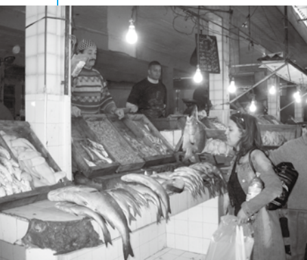
△モロッコの魚屋さん

また、モロッコの隣国であるスペインでもキンタロウの評価は高く、スーパーマーケットではキンタロウの冷凍品が美しく印刷された紙のケースに入れられ販売されているのを見ました。「萩の金太郎」も外国のキンタロウ以上に評価が上がって欲しいと願うものがあります。