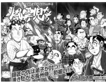
桂小五郎や高杉晋作が表紙の「コミック乱」4月号

04年に歴史マンガの新境地開拓とマンガ文化の貢献により、第8回手塚治虫文化賞特別賞を受賞。