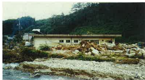
(S60 山口市ため池決壊事例)