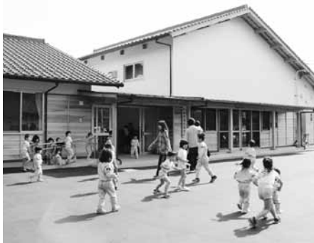
須佐保育園新園舎

17日 須佐保育園新園舎が完成 須佐地域の復興のシンボルとして、新しい園舎が完成。21日には新園舎から7人が卒園