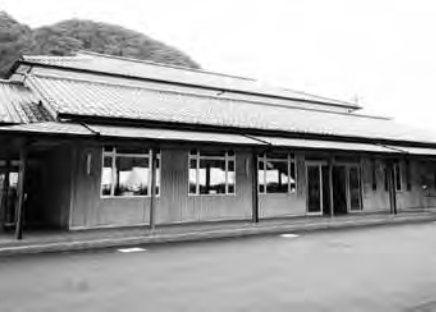
小川交流センター「みのり」 10月から館内に交流の場として 「みのりの広場」もオープン