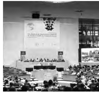
ユネスコ世界遺産委員会(ドイツ・ボン、日本時間7月5日)

5月4日にイコモスが登録勧告した、萩市の萩反射炉、恵美須ヶ鼻造船所跡、大板山たたら製鉄遺跡、萩城下町、松下村塾の5資産を含む「明治日本の産業革命遺産」がユネスコ世界遺産委員会で登録決定、8日に正式に登録。18日には、松下村塾が近代化・工業化に果たした役割などを紹介するシンポジウムを開催