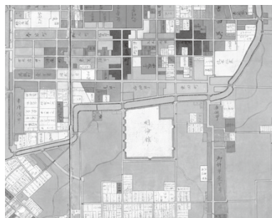
部分拡大(藩校明倫館付近)

三角州の低湿地を利用し、元からあった「まち」を壊さない開発ができたからこそ、萩の「まち」では、江戸時代の城下町絵図を、現在でもそのまま地図として用いることができるのです。