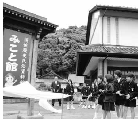
須佐歴史民俗資料館

14日 須佐歴史民俗資料館リニューアルオープン 萩市東部集中豪雨災害の被災から1年9カ月、多くのボランティアの尽力により、愛称「みこと館」として再開館