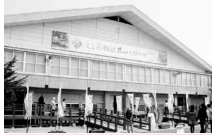
文と秋物語 花燃ゆ 大河ドラマ館 会期は平成28年1月10日まで 大河ドラマ館で、もう一度ドラマの感動を体験してください。

4日 大河ドラマ「花燃ゆ」放送開始 吉田松陰の妹「文」の生涯と、幕末・明治維新という近代化を目指す日本の姿を描く。12月13日まで全50回を放送