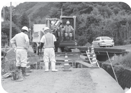
下水道工事の様子