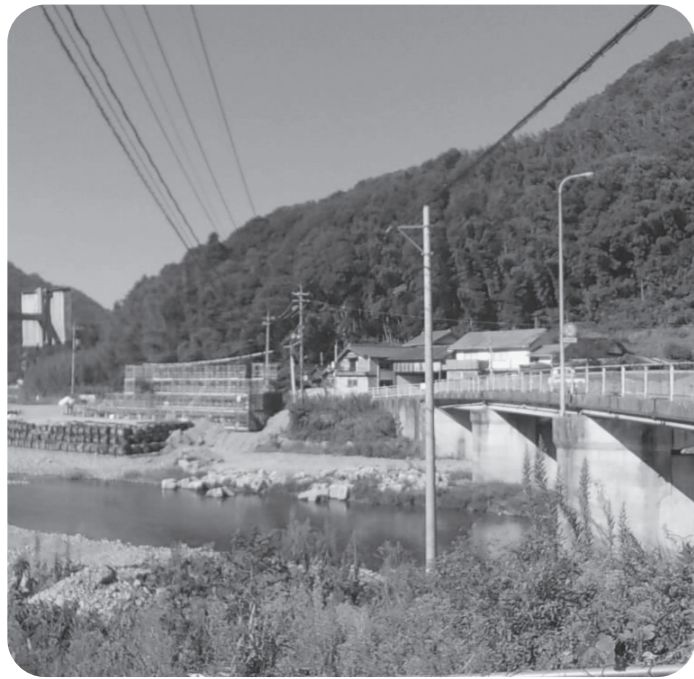
田万川の河川改修の高岩橋

経済建設委員会に付託された議案13件は審査の結果、すべて可決すべきものと決しました。審査の主な内容は、次の通りです。