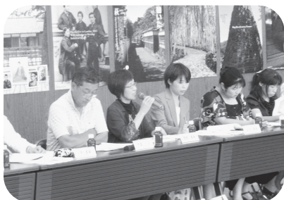
総合戦略策定委員会

【答】 萩市総合戦略推進委員会は「産官学金労言」の各分野の有識者と住民代表で構成しており、平均年齢は60歳、男性17人、女性8人です。青年会議所連合山口、まちづくりの会など若い世代で構成される団体にも委員に就任いただき、その意見を伺っています。また、これら団体に所属される皆さんとも意見交換を行なっており、これまでも行ってきた若い方との意見交換の内容も踏まえながら総合戦略を策定していくこととしています。