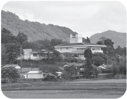
福祉複合施設「やまびこ」