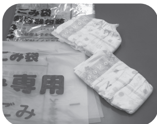
紙おむつとごみ袋