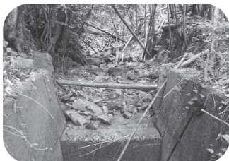
管理できていない水路