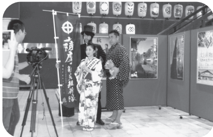
薩摩観光維新隊（市役所ロビーにて）

こうしたつながりも踏まえ、今後記念イベントの詳細について検討し、薩長同盟150年記念事業を実施することにしていきます。