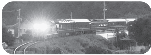
トワイライトエクスプレス

「トワイライトエクスプレス」や「瑞風」の話が進行していることから、これらと競合しない萩博物館の企画のような、地道ながら一般観光客が参加しやすい内容で、事業として成り立つようなものを組み立て、実現するよう検討します。