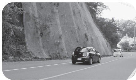
主要道・萩篠生線