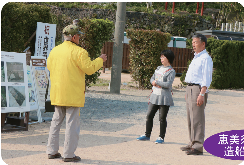
恵美須ヶ鼻造船所跡

A いい所ですね。世界遺産なので、恵美須ヶ鼻造船所跡地に来ました。今日は、萩に泊ります。