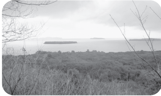
笠山から見下ろす風景

【答】国定公園である笠山の景観保持のため、山口県環境衛生部自然保護課が緊急雇用対策として相当の樹木の伐採を行いました。その後、部分的にしか眺望が効かなくなっています。景観保持のため何か方法がないか自然保護課とも相談を行っています。今、越ヶ浜地区でも小中学校の皆さんをはじめ多くの方々に、様々な形でジオパーク活動を盛り上げていただいています。萩の文化・歴史・自然のうち自然の部分をしつかり取り上げていきたいと考えています。