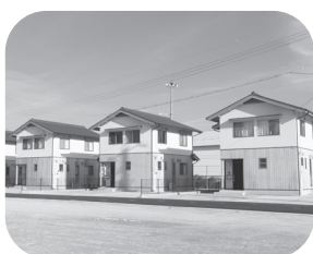
須佐の移住者専用住宅

【答】少しでも人口の減少率を抑えることが、萩市の課題になっています。今、空き家バンクの取組みに力を入れており、改修や賃貸への補助制度とともに、物件を紹介する移住支援員や地域移住サポーターの機能を強化し、移住者に萩の特性や事情を十分に解いただけよう努めています。市民が来た人を温かく迎え、若い人が萩に残ってもらうための働く場を確保する事が最大の課題です。