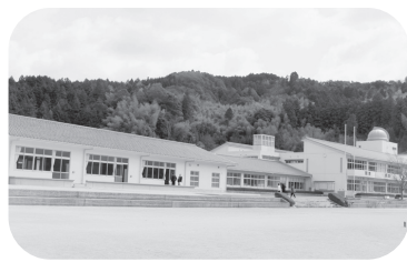
福栄小学校・中学校

《他の質問項目》 ○ 萩市役所本庁の窓口業務について ○ 寒波時の上下水道部のあり方について