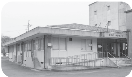
診療所が設置される田万川保健センター

【答】田万川地域の民間医療機関が、昨年12月末で廃業となりました。これに伴い移動手段を持たない方のために、緊急対応として本年1月から須佐診療センターへの通院支援を行ってきました。これまで通りの医療提供体制が確保できないかと各方面へ協議をしてきましたところ、本市の嘱託医として就任いただける医師を確保する見通しがつきました。本年10月に、田万川保健センター内において国民健康保険診療所を開設することを検討しています。