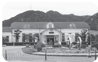
銅像建立予定の萩駅

【答】東京駅前の井上勝像が来年には再設置されます。萩の銅像はその前に、10月14日の鉄道記念日に合わせて建てられないかと考えています。JRでは、トワイライトエクスプレス「瑞風」や幕末ISHIN列車の運行などが計画されています。蛭子能収氏に関しては、萩を含むルートで路線バスを乗り継ぎ目的の地まで行くテレビ番組が、すでに放映されています。交通関係者もいろいろの方がいますので、井上勝公の関連で今後検討していきます。