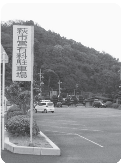
萩市営有料駐車場（越ヶ浜）