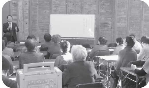
「終活セミナー」の様子