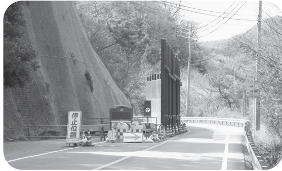
交通規制されている現場

【答】 2月24日には、県知事に直接、早期復旧への要望を行い、知事からは「危険性は認識しており、リサイクルセンター付近からの800mの調査結果を待つて対応を検討する。」との回答をいただきました。今後も市議会、地元住民の方々などと一丸となって早期復旧を要望していきたいと考えます。