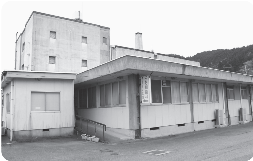
診療所が設置される田万川保健センター（診療所入口側）