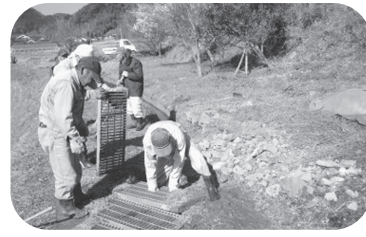
水路維持の共同作業

《他の質問項目》 ○ 過疎の激化をどう食い止 め振興するか ○ 広域災害と住民の活動 障がい者就労継続支援事 業の工賃向上計画と萩市 の対応について