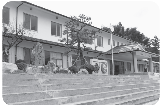
明木小・旭中学校