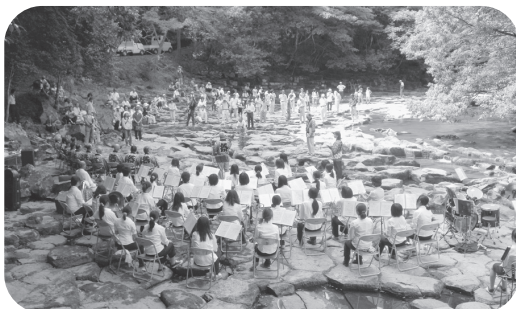
山口県立大学ブラスバンド部による置ヶ淵コンサート