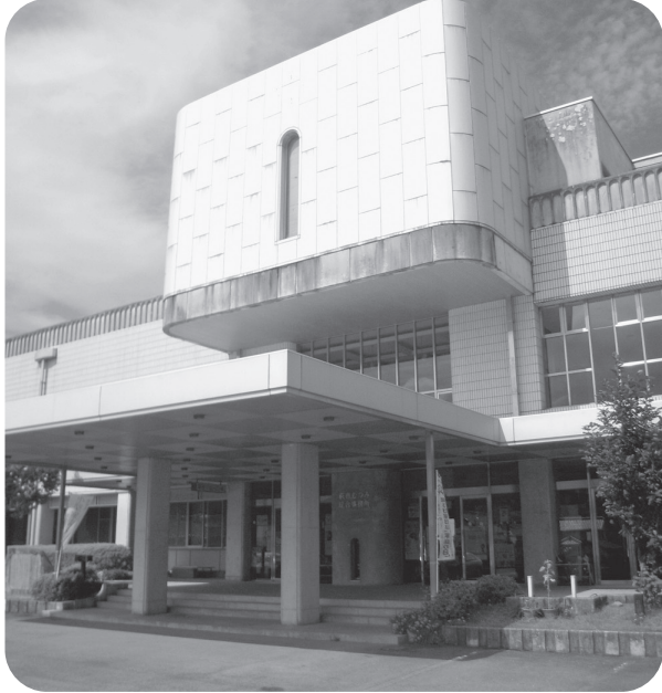
むつみ総合事務所