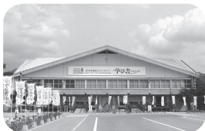
萩・世界遺産ビジターセンター学び舎

また、明治維新関係学会の招へいや、博物館の企画展などの実施を議論していますが、こうした企画を検討する委員会を設置して記念事業を計画していきたいと思えます。