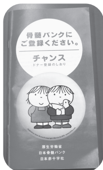
骨髄バンク登録のしおり

【答】山口県内では、去年から宇部市が骨髄移植ドナーへの支援を行っています。市では、市職員が骨髄提供する場合、特別休暇を設けています。平成23年度、25年度、26年度、28年度、各1名が特別休暇を取得し、骨髄提供を行っています。 骨髄バンク制度のお陰で、命を取り留めた方もいらっしゃると思いますので、県内唯一の移植医療機関である山口大学医学部附属病院の先生から現状を聞いてみたいと思います。