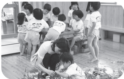
元気に遊ぶ子ども達

【答】萩市病児・病後児保育事業は、楽々園に4床、弥富診療所に2床あり、2箇所で開催しています。病児の入院・加療の受入れは萩市民病院小児科で10床となっています。実施にあたり施設・人員配置の基準による制約があり、インフルエンザや溶連菌等複数の感染症がある場合に受入の希望にに応えられない場合も若干あります。市では小児科医師の確保等最大限の努力をしてきており、今後は、病児の扱いについて場所等議論してまいります。