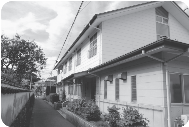
萩市高齢者生活支援ハウス「みしま」

教育民生委員会は、議案4件が付託され、審査の結果全て原案通り可決すべきものと決しました。