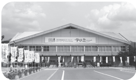
学 び 舎

学び舎については、オープン時にスポット的にCMを行いました。今後も、萩・明倫学舎の宣伝と併せてエージェンツ等の対策を図ることとしています。