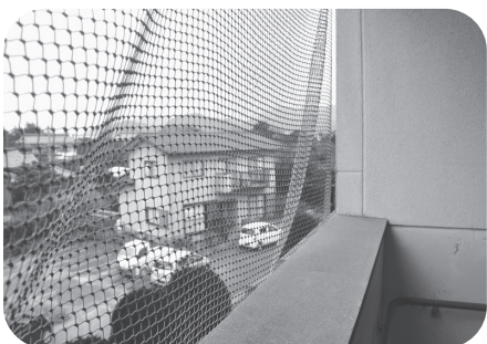
ハトよけネットを設置した市営住宅

【答】苦情や相談件数は年間20件程度ですが、増加傾向にあります。騒音・敷地内への迷惑駐車、野良猫への餌やりやハトの住みつき、高齢化に伴う団地内の草取りや生垣の剪定ができないといった苦情や相談があります。苦情等には的確に対応できるように、建築課の職員が現場を確認して対応しています。内容によっては、他の部署と連携して対応することになります。相手の立場に立ち相談に乗るよう注意していきます。