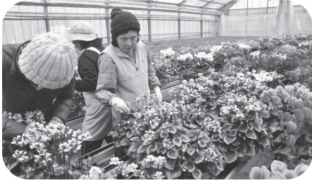
花き農家の作業風景