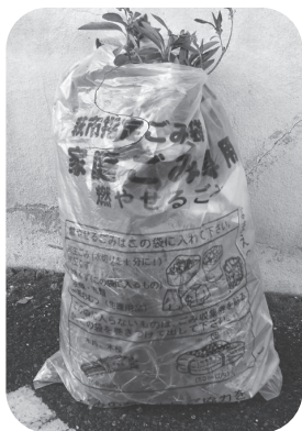
ゴミとして出された剪定枝

【答】ごみ袋の値段については、ごみ減量化のための萩市独自の施策であり、無料配布した以上のごみの排出について負担をお願いするもので、ごみの排出量は平成17年度と比較して約23%減少しています。雑がみの分別推進については、国・県の回収実績を下回っており、排出・収集方法を含めて検討して行きます。萩・長門清掃工場への直接搬入料金については、従前の50kg毎500円から10kg毎100円に変更し利便性の向上を図ったところで