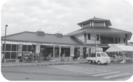
道の駅「ゆとりパークたまがわ」

また、萩市独自の地域性のある共通するおもてなしを行うには、道の駅職員も一丸となって対応していく必要があることから、職員の教育、研修についてマニユアルの策定を検討していきます。