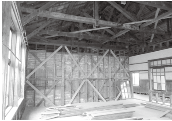
※1 壁筋違いでの耐震補強の状況

外周壁と廊下の間仕切壁の足元にはコンクリートの布基礎（細長く連続した基礎）があります。今回の工事では外観を変えることなく、既存の基礎の内側に鉄筋コンクリート造の基礎と特殊繊維により補強して剛