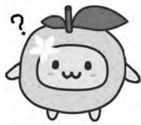
夏みかん物語マスコット “なつみん”