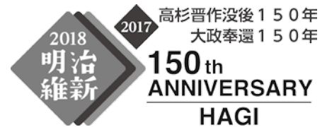
平成29年 明治維新150年記念事業ロゴマーク

高杉晋作没後150年 大政奉還150年 150th ANNIVERSARY HAGI