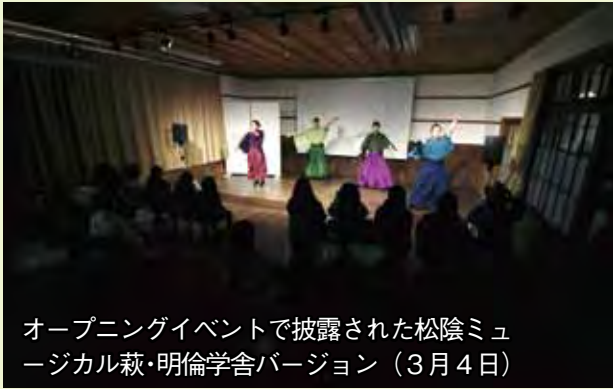
オープニングイベントで披露された松陰ミュージカル萩・明倫学舎バージョン（3月4日）