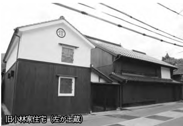
旧小林家住宅（左が土蔵）

4月15日から公開活用を開始 建物の公開に加え、地元の「萩往還佐々並どうしんてやろう会」が来訪者をおもてなしするとともに、