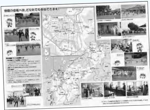
健康体操拠点マップ

平成28年度、市では、「目指せ！減塩！」「毎日仲間と楽しく体操！」「地域に出よう！活動しよう！」をチャレンジ目標に挙げ、県内でも低い水準で推移している健康寿命（自立的に日常生活を送ることができる期間）の延伸に取り組んできました。