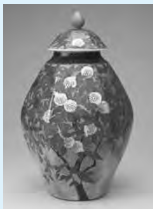
十四代今泉今右衛門 「色絵薄墨墨はじぎ柘榴文蓋付瓶」 (2011年)