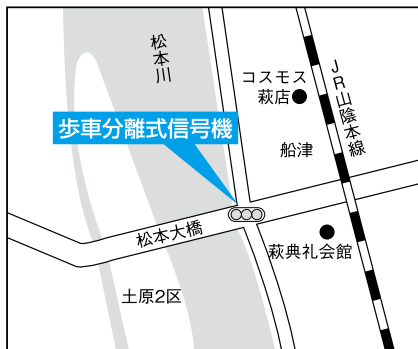
③松本橋東詰交差点(樫東)