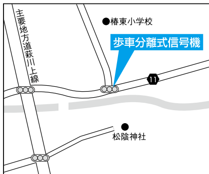
①松陰神社北交差点(樫東)

各信号機は押しボタン式となりますので、歩行者用信号が青色に変わってから横断してください。車両は見込み発進せず、必ず対面の車両用信号灯器を確認して発進してください。 ※午前7時～8時は、押しボタンによらず自動で信号が変わります。