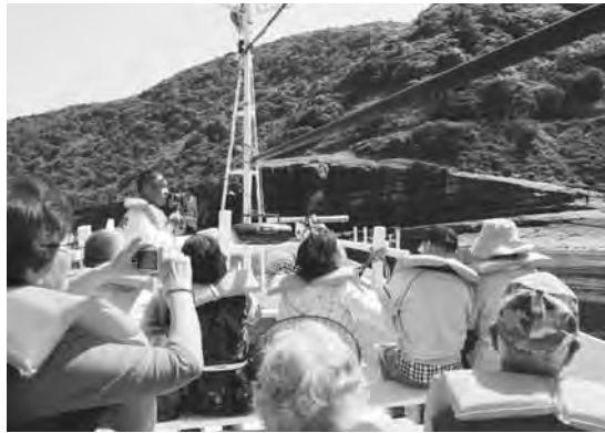
須佐湾ジオクルージング

ジオパーク活動は、地域の課題を踏まえ、ジオパークでどのような地域を創っていくのか、また、それぞれの地域が活性化して潤う仕組みづくりについて、さまざまな意見をいただきながら、地域の皆さんとともに考えていくものです。