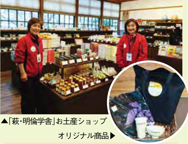
▲「萩・明倫学舎」お土産ショップ