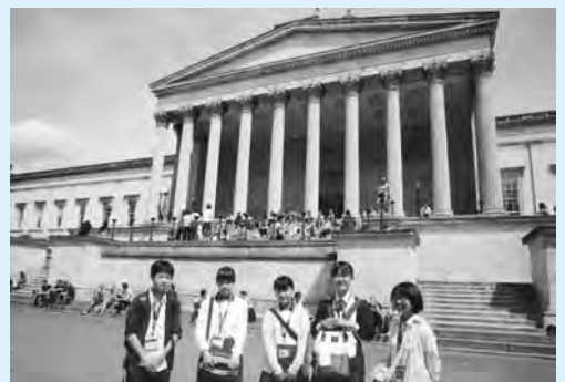
昨年の長州ファイブジュニアの様子

市では、平成18年度から国際的視野の広い人材を育成する目的で、次代を担う市内中学生を対象にした「長州ファイブジュニア語学研修」を実施しており、今回で11回目となります。