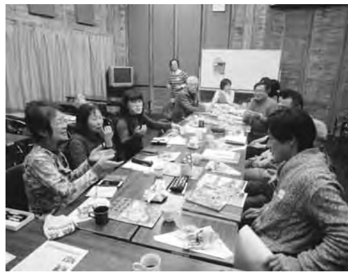
ジオカフェの様子

萩ジオパーク構想推進協議会では、今年度も引き続き出前講座、現地ツアーを行います。町内会・自治