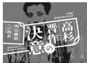
「高杉晋作の決意-明治維新への助走-」 図録A5版 1,000円

上海から帰国した晋作が久坂玄瑞・志道聞多(井上馨らと外国勢力排撃を誓った血盟書を展示。これがイギリス公使館焼き討ちに発展した。