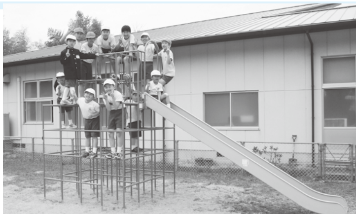
寄付金を活用して整備した多磨小学校の遊具