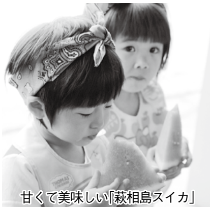
甘くて美味しい「萩相島スイカ」