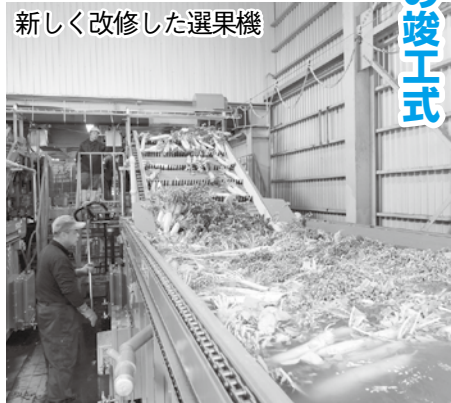
新しく改修した選果機

また、出荷式と併せて、老朽化した洗浄選果機の更新など選果施設の竣工式も行われました。総事業費は、約1億6700万円で、使用水量の減少や作業時間の短縮が期待できます。