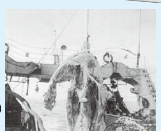
▲ニューネッシー