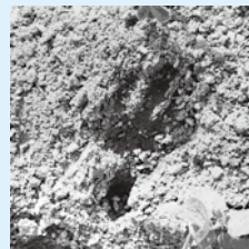
▲ガタゴン足跡