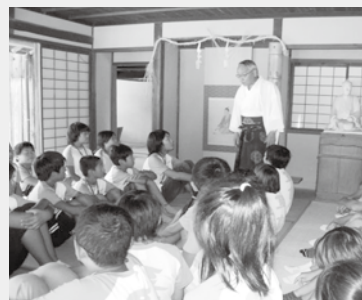
明治維新140年記念事業の様子

■鹿児島市と萩市の小学生が「明治維新胎動の地 萩」で先人たちの生き様や「進取の精神」に志を学ぶ「維新塾」を開催。