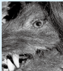
▲シイ (復元模型：萩博物館)