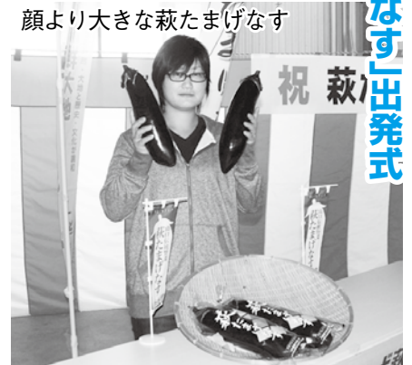
顔より大きな萩たまげなす

7月上旬ごろまでに、県内をはじめ首都圏へ3万本を出荷、1000万円の販売を目指します。