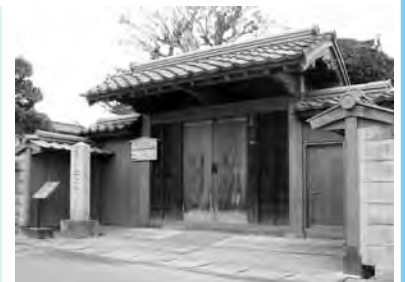
改修後の井上勝旧宅門