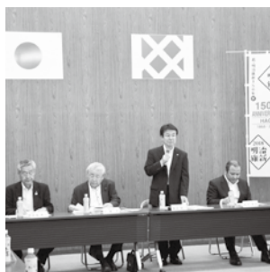
実行委員会の様子

委員会では市民提案型のイベントや、国・県と連携した事業の実施などについて意見がありました。