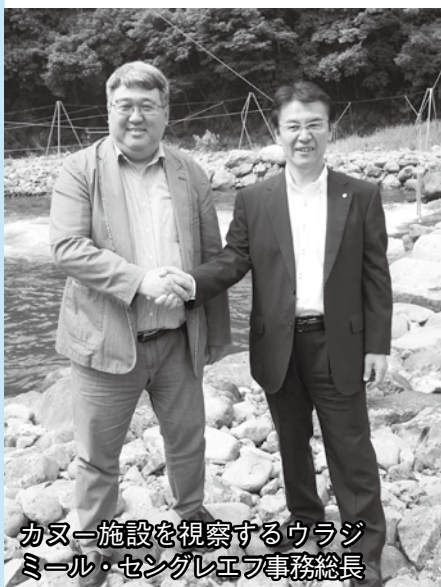
カヌー施設を視察するウラジミール・セングレエフ事務総長

阿武川特設カヌーコースは平成23年の山口国体で整備されたもので、阿武川ダムのふもとにあり、藤道市長が日本トッ