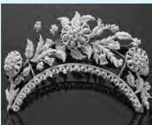
△シードパールティアラ(19世紀初期、イギリス) 穂葉アンティークジュウリー美術館蔵