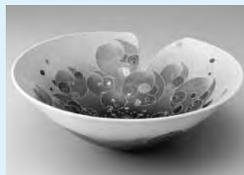
△十四代今泉今右衛門「色絵薄墨墨はじき海芋文鉢」(2010年)