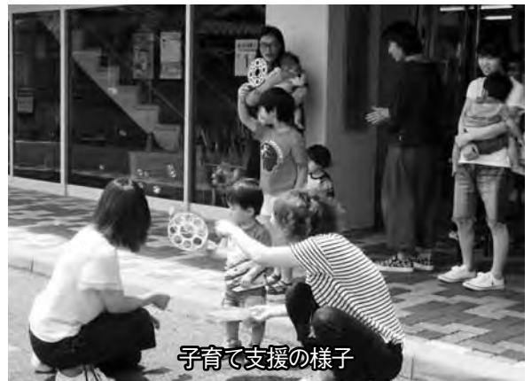
子育て支援の様子

自営農地等の規模を維持する農家の後継者または年間60日以上農作業に従事する準主業農家の方（年齢55歳以下）を対象とし、最大3年間助