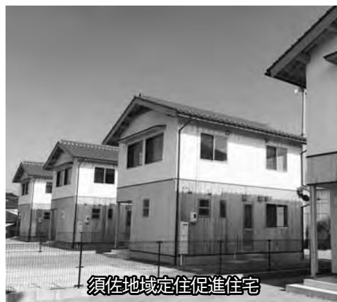
須佐地域定住促進住宅

東部地域の復旧・復興に併せた少子化対策として、須佐地域に市外在住者を対象とした子育て世帯向けの低家賃住宅を4戸追加整備します。