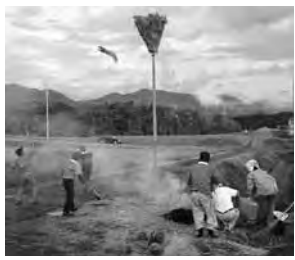
むつみ地域で現在も行われている牛灯と同様の行事

○江戸後期の「防長風土注進案」によると旧暦7月7日から盆の間牛灯といって、2間(約3.6m)余りの竹竿の上に、ホオズキの形のもの(籠)をこしらえてつけ、これを立て、麦わらや竹などのたいまつに火をつけてホオズキをめがけて投げける遊びを行う。この遊びをしない年は水の中からシイという獣が出現し、たくさん牛が死んだと伝えられる。