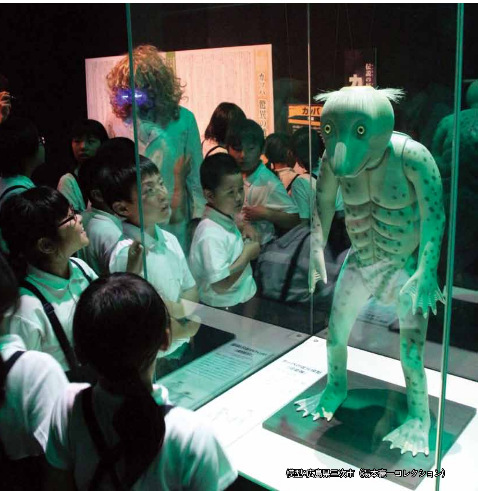
模型：広島県三次市（湯本豪一コレクション）

編集・発行／萩市総務企画部広報課 〒758-8555 萩市大字江向510番地 TEL 0838-25-3131(代) FAX 0838-26-5458 ホームページ http://www.city.hagi.lg.jp/