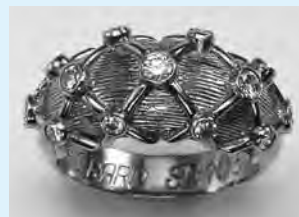
ダイアナ元妃のダイヤモンドリング 1985年 フランス ルイ・ジェラル