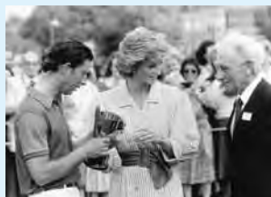
特別出品 ダイアナ元妃ゆかりのリング チャールズ皇太子と左手薬指にリングをつけるダイアナ元妃