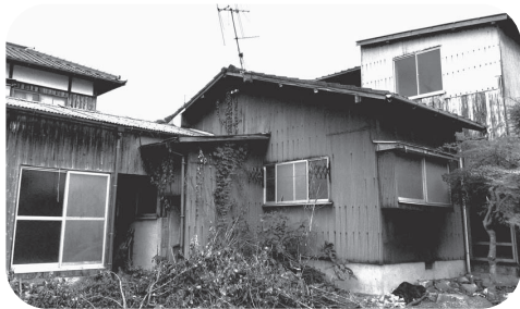
市内にある老朽空き家