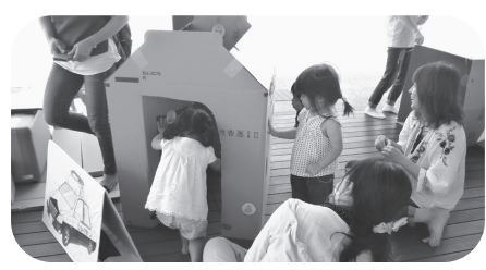
楽しく遊ぶ子ども達