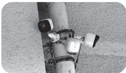
市内社会福祉施設の防犯カメラ

【答】昨年7月に神奈川県相模原市の障がい者支援施設で発生した事件は社会に大きな衝撃を与えました。福祉施設における防犯マニュアルを策定するためのガイドラインについては、現在、国において策定を進めている状況です。したがって、国から公表されましたら、県を通じて各施設に示されることになっていきますので市が独自にガイドラインを策定する予定はありません。