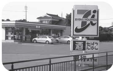
条例の規制を受けた看板

【答】現行の景観形成基準が基本的に歴史的景観との調和を求めるもので、市全域を対象にしていることから、歴史的景観を守るべき区域とそれ以外の区域とのメリハリに欠け、また区域によっては過度な内容と受け取れる部分もあります。市民の皆様から様々なご意見を頂いておりこの状況を踏まえ、景観形成基準の内容を見直し、良好な景観形成と活発な商業行為が両立でき、市民生活に過度な負担が生じない内容に整えたいと考えています。