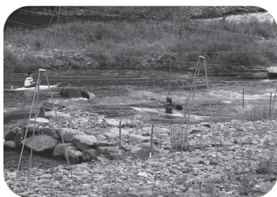
阿武川カヌー競技場

温泉湧出量の減少原因を調査すると共に、施設は必要に応じて臨時的な整備を検討します。英国大使にお会いし、英国カヌーチームの事前キャンプ誘致を行うなど、相互交流事業に取り組んでいます。