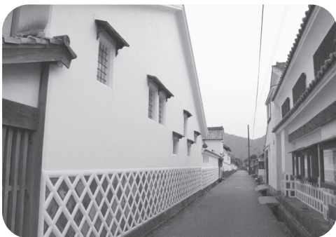
世界遺産 萩城下町