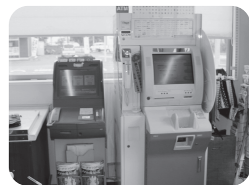
証明書等を発行する端末機（左側）

答 基本的には、マイナンバーカードを使用して手続きを行いますので、機械のアナウンスに沿って操作することになります。発行した証明書等と取り忘れた場合も、サイレンが鳴るシステムになっています。