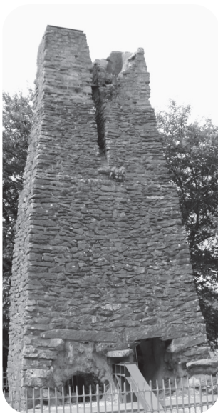
世界遺産 萩反射炉