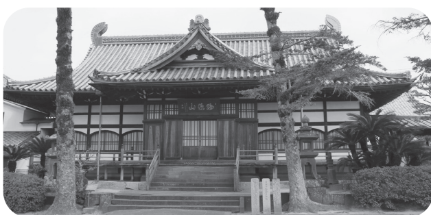
海潮寺本堂 (孔子廟)

不確定な状況でお話しするよりも、しっかりと現状を把握し、旧明倫小学校校検討委員会の設置を議会で認めていただいたところで、海潮寺へお伺いして、お伝えしたいと思つています。