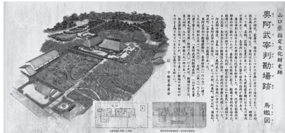
現地にある案内看板

一方で、整備については、限られた予算の中で、市の文化財全体やむつみ地域の産業・地域振興を推進するという観点からも優先度を勘案し、検討する必要があります。また定期的な草刈りを継続していくと共に地元の文化財保護指導員と連携を図り、現地の維持や美化に努めます。加えて、史跡の価値の向上を図るため必要な調査等の実施を検討し、国指定に向け努力します。