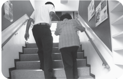
三見公民館の階段

【答】指定避難所に定められている総合事務所、支所、出張所は11施設あり、このうち、7割強の施設について、耐震性があり一定の耐久性も確保されています。また、エレベーター・スロープ等の設置によりバリアフリー化もされている状況です。なお、安全性や利便性を伴わない施設については、施設の老朽化、若しくは他施設との集約化による建替え又は改修に併せて、耐久性の確保、バリアフリー化等利便性の向上を図る方針で進めます。