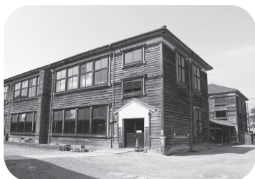
旧明倫小学校校舎3・4棟

《他の質問項目》 。広域合併後に周辺部となった旧町村地域の振興について 。地域産業の再生、活性化」と農山漁村政策について