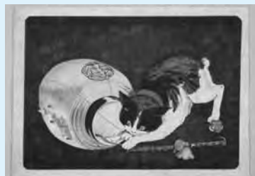
こばやしきよちか △小林清親「猫と提灯」 横大判錦絵 明治10年(1877) 千葉市美術館蔵