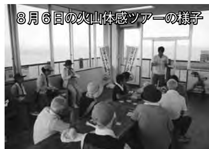
8月6日の火山体感ツアーの様子

8月6日に、笠山山頂で開催した「日本一おもしろい火山体感ツアー in 笠山をみんなでつくるろう」では、大地と人の関わりを知ってもらえる素材としての「笠山・越ヶ浜地区」を学ぼうという学習会の発案がありました。また、山頂展望台から見える日本海に浮かぶ島々などの成り立ちは、どうやったら来訪者に伝わるかを考えてみることになりました。小さな動きですが、ジオパーク活動の端緒といえます。