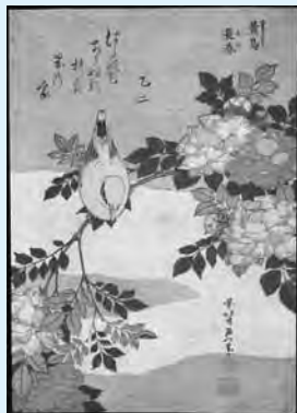
こちよう ちようしゅん ▷葛飾北斎「黄鳥 長春」 中判錦絵 天保5年(1834)頃 島根県立美術館蔵