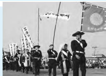
萩時代パレードの様子

■主催・申し込み 〒758-8555 萩市観光課内萩時代まつり実行委員会事務局(25・3139、FAX26・0716、Eメールkankouka@city.hagi.lg.jp)