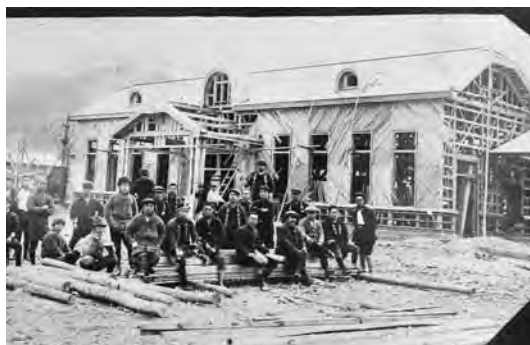
萩駅建築中、木材は川上から運ばれた