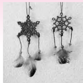
羽根を使ったアクセサリ

○クラフト体験 毛皮や羽根を使ったオリジナルアイテムを作ってみませんか?(数量限定)