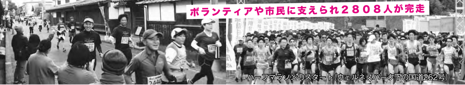
ハーフマラソンのスタート(ウェルネスパーク下の国道262号)

世界遺産の構成資産である、萩城下町を駆け抜ける「第18回維新の里萩城下町マラソン」が、12月10日、萩ウェルネスパークをスタート・ゴールに行われ、ハーフマラソンなど4種目に、北海道から鹿児島県まで全国31都道府県から3389人がエントリーし、2808人が完走しました。今大会も、約1100人のボランティアによる給水や交通整理などのほか、多くの市民の皆さんの沿道での声援により支えられました。 城下町では、萩西中学校吹奏楽部による演奏が参加者を後押しし、萩ウェルネスパークでは、萩市女性団体連絡協議会による夏みかんジュース、山口県漁協女性部によるふぐ鍋が振る舞われました。温かいご声援、ご協力ありがとうございました。