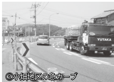
②小畑地区の急カーブ