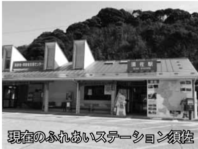
現在のふれあいステーション須佐