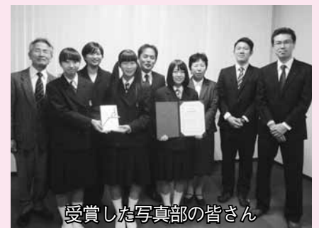
受賞した写真部の皆さん

身近な風景から環境問題を考え、行動することを目的とした第13回昭和シェル石油環境フォト・コンテスト「わたしのまちの〇と×」で萩