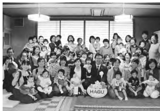
子育て世代包括支援センターHAGU

若い世代が安心して子どもを産み育てることができるよう、小学校卒業までを対象とした現行の医療費助