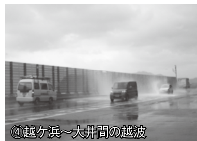
④越ヶ浜～大井間の越波