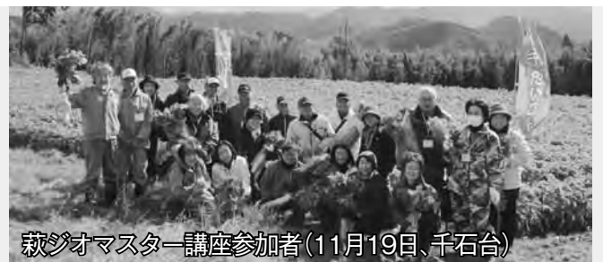
萩ジオマスター講座参加者(11月19日、千石台)