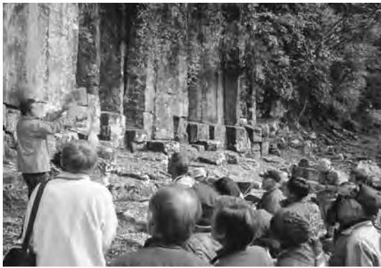
弥富壺ヶ淵でのジオマスター講座

遺産を守り、学び、生かしたまちづくりを進めます。平成30年は、日本ジオパーク認定とジオパークとしての萩の発展を目指して取り組んでまいります。