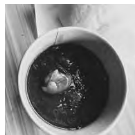
イノシシ肉のシチュー