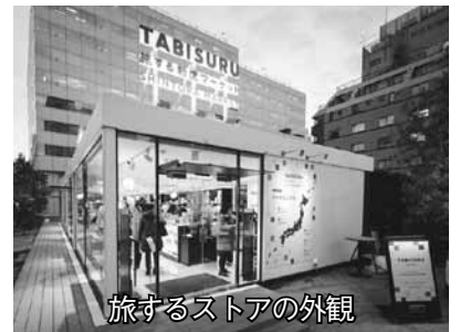
旅するストアの外観

明治維新150年を記念して、萩市の魅力ある特産品のPRや観光誘客の促進を図るため、平成30年1月から3月まで東京で開催される「旅する新虎マーケット」への参加費用等を支援します。