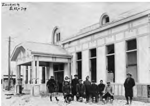
鉄道遺産萩駅竣工

■とき 2月18日(日)、3月11日(日)、それぞれ午前8時から10時30分から ※詳しくは、萩博物館ホームページへ。