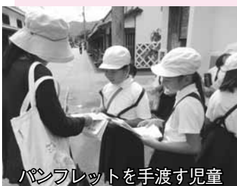
パンフレットを手渡す児童

4年生の「ふるさと萩のよさを紹介しよう」の総合学習では、調べたことをパンフレットにまとめ観光客などに手渡しました。