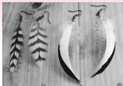
羽根を使ったピアス