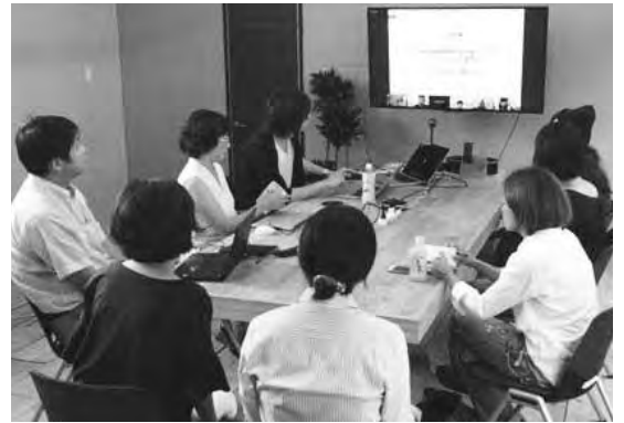
萩サテライトオフィス「So-Say Lab.」