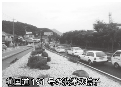
①国道191号の渋滞の様子

大井～萩間の国道191号では越波や交通事故による通行止めが度々発生しています。また通行止めとなった時には、大幅な迂回を強いられ、生活や産業に大きな負担が発生しています。〔写真④〕