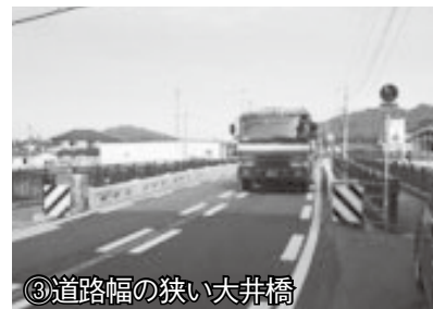
③道路幅の狭い大井橋