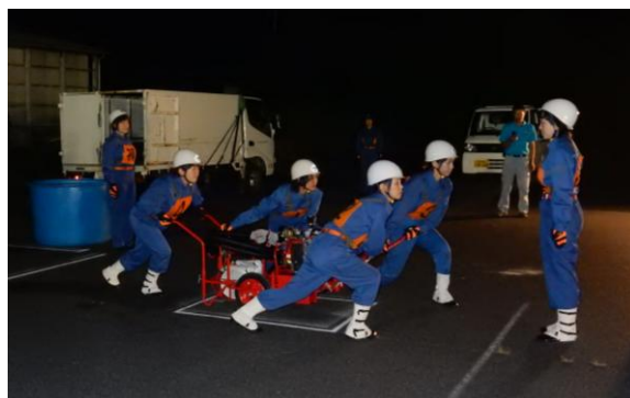
訓練に励む 第8分団女性消防団員