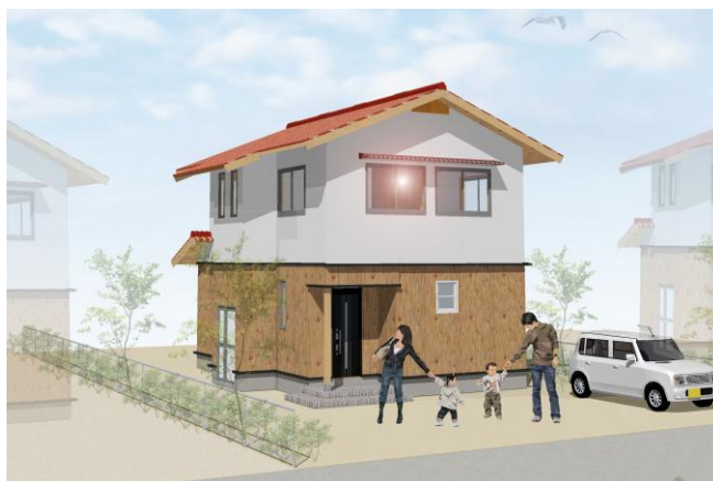
東部(須佐)地域定住促進住宅イメージ図