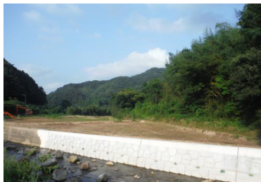
田万川地域（小川7区 農地と梅の木川）