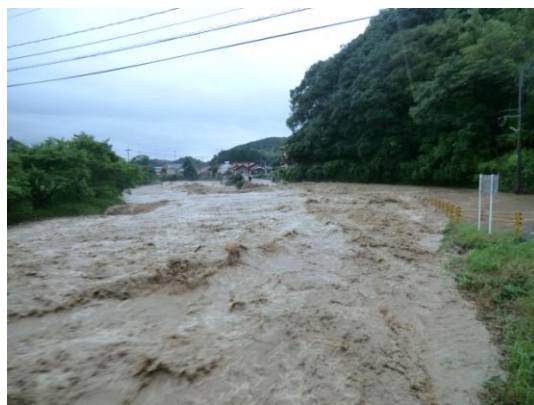
蔵目喜川の氾濫（H25.7.28 むつみ地域 吉部下） 予想外の突然の豪雨に東部各地の川が氾濫した