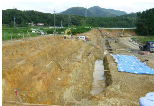
須佐地域（火打岩ため池 施工中H27.9.3現在）