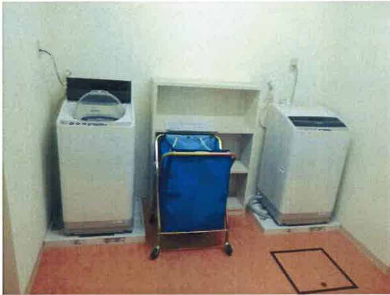
洗濯乾燥機を完備