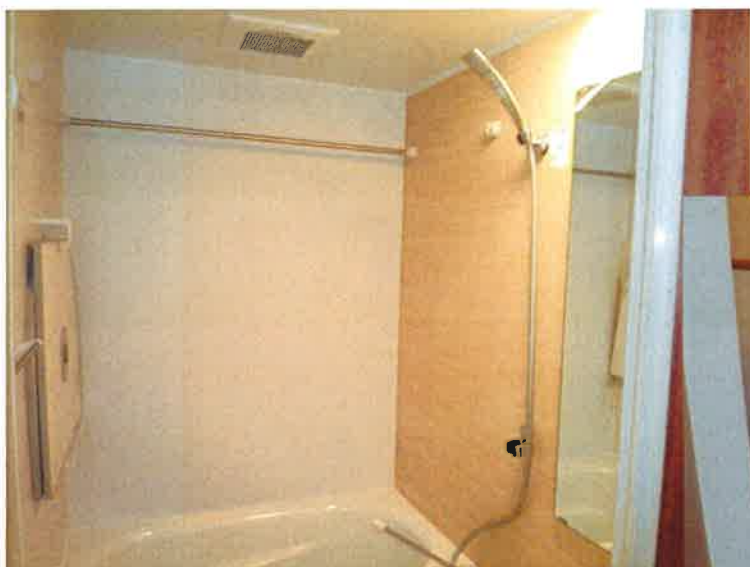
バス・トイレは個室に完備