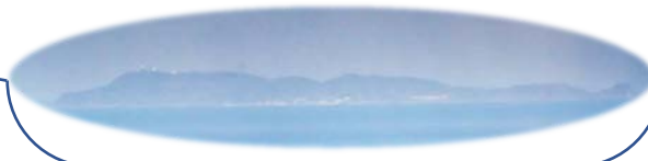
つるえだい 鶴江台

しゃしん うつ 写真にはよく写らなかったけれど、 たとこやまさんちょう てんぼうだい 田床山山頂の展望台からは みしま み 見島も見えます！ みしま み 見島が見えたら、11になります。