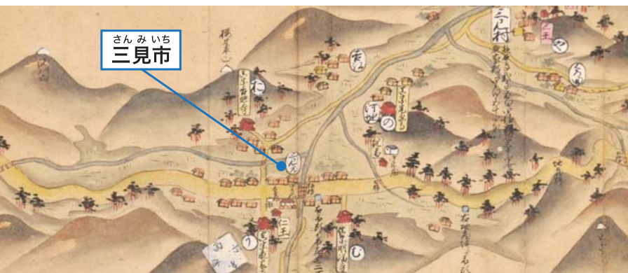
「御国廻御行程記」(萩博物館蔵)

三見市は寛文5年(1665)に赤間関街道の宿駅に取り立てられ、萩城下に近い宿駅のひとつとして人や馬を取り継ぎ、宿や食糧を提供していました。現在も旧街道に沿って軒を連ねる家々が建ち、高札場や目代所の跡、薬問屋を営んだ家などが残されています。